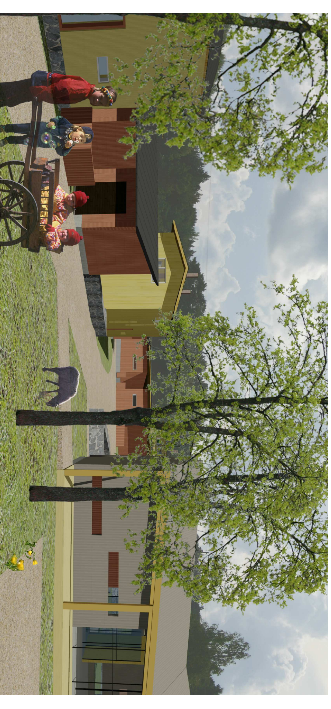
kytälö ja kyä etelän suunnasta

Suunnitteluvuorueen keskivaiheilla itä-länsisuunnassa sijaitsevaa ojaa ja kosteikkokoluetta laajennetaan. Kosteikkoja voidaan käyttää biologisen puhdistuksen haridutus alueina, jos tulevat asukkaat haluavat toimia ekokyläsuunnun periaatteiden mukaan. Muussa tapauksessa ne ovat puistomaisia sahlais- ja tupasvillamittaitä asukkaiden silmän iloiksi.