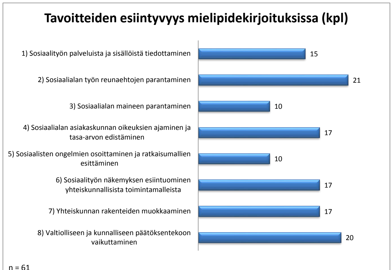
Kuvio 2. Tavoitteiden määrällinen esiintyvyys mielipidekirjoituksissa

Kaikkia listattuja tavoiteryhmiä esiintyy aineistossa tasaisesti, mutta joitain merkittäviä eroavaisuuksia ryhmien esiintyvyydessä on nähtävissä. Aineiston yleisimmät tavoiteryhmät ovat sosiaalialan työn reunaehtojen parantaminen , joka on tavoitteena 21 mielipidekirjoituksessa sekä valtiolliseen ja kunnalliseen päätöksentekoon vaikuttaminen , joka esiintyy mielipiteissä 20 kertaa. Molemmat kyseisistä tavoiteryhmistä sisältyvät siis peräti kolmasosaan aineiston teksteistä. Suhteellisesti vähiten mielipiteissä tavoitellaan sosiaalialan maineen parantamista ja sosiaalisten ongelmien osoittamista ja ratkaisumallien esittämistä : kumpikin tavoite esiintyy aineistossa 10 kertaa, eli kuudesosassa kaikista aineiston teksteistä.