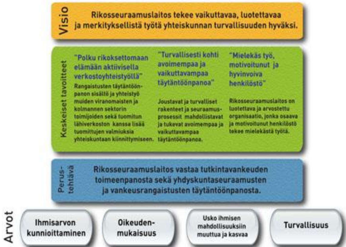
Taulukko 3. Rikosseuraamuslaitoksen toiminta ja arvot (Rikosseuraamuslaitos 2015)

Vankeusrangaistus ja vapauden sekä itsemääräämisoikeuden osittainen menetys on ankarin seuraamus, minkä suomalainen yhteiskunta voi lainvastaisesta teosta langettaa (Granfelt 2011, 215.) Lain vankeusrangaistuksen toimeenpanosta (767/2005) mukaisesti vangin ainoa rangaistus tulee olla vapaudenmenetys, jolloin olosuhteet ja puitteet on luotava mahdollisimman samankaltaiseksi yhteiskunnallisiin oloihin verratessa. Ongelmallisena kysymyksenä voidaan nähdä se, miten sosiaalityön arvot ja eettiset lähtökohdat voivat toteutua laitoksessa, jossa asiakasryhmänä on syrjäytynyt marginaaliryhmä? Vankilaorganisaatiota ei ole luotu vuorovaikutukseen ja kuntouttamiseen vaan rankaisemista ja säilytystä varten. Vankilassa ilmenee vahva henkilökunnan ja vankien vastakkainasettelu ja epäluottamus, jossa ei juuri ole tilaa herkkyydelle ja ystävällisyydelle. Miten siis toteuttaa tällä kentällä sosiaalityötä, jonka tunnuspiirteitä ovat luottamus, rehellisyys, avoimuus ja itsemääräämisoikeuden