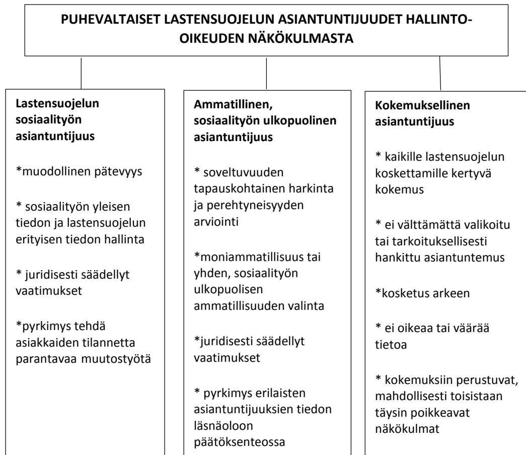
Kuvio 1. Lastensuojelun asiantuntijuudet hallinto-oikeuden näkökulmasta.