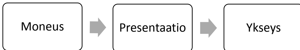
Kuva 3: Moneuden ensisijaisuus presentaatiossa

Lupasin aiemmin näyttää, miten Badiou kääntää läsnäolon ontologioiden esittämän ykseyden ensisijaisuuden suhteessa moneuteen ylösalaisin. Edellisten tilannetta, moneutta ja yhdeksi-laskemista koskeneiden pohdintojen pohjalta tähän voidaankin vastata hieman paremmin. Presentaatio merkitsee moneuden ensisijaisuutta ainakin siinä mielessä, missä puhdas, inkonsistentti moneus edeltää yhdeksi-laskemista ja konsistenttia moneutta. Läsnäolon, ykseyden ja ūsian välistä yhteyttä käsitellessäni totesin, että kaikki läsnäolo on aina samalla jonkin yhden läsnäoloa. Kaiken moneuden ”taustalla” on aina jokin ykseys. Presentaatiossa moneuden ja ykseyden välinen suhde on toisin päin: yhdeksi-laskemisen tuottaman ykseyden taustalla on aina moneus. Ainakin tässä mielessä Badioun lause ”presentaatio on läsnäolon eksakti vastakohta” voitaisiin ymmärtää. Tämä määritelmä mahdollistaa samalla Badioun läsnäolon käsitteen ymmärtämisen ilman viittausta subjektin ja ajan kaltaisiin kategorioihin.