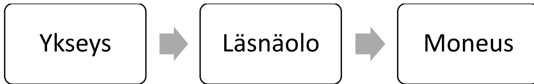
Kuva 4: Ykseyden ensisijaisuus läsnäolossa

Olen tässä osiossa lähestynyt Badioun ontologiaa ikään kuin olemisen ja ilmenemisen välissä. Varsinaiseen ontologiaan, toisin sanoen matematiikkaan on vasta viitattu. Toisaalta myöskään Badioun ilmenemistä koskevien käsitysten luonne ei ole valjennut riittävällä tarkkuudella, jotta väitteeni ontologisesta erosta olemisen ja ilmenemisen välisenä erona kävisi ymmärrettäväksi. Seuraavassa luvussa lähestyn Badioun käsitystä ilmenemisestä ja näytän, miten Badiouille ontologinen ero on samalla olemisen ja ilmenemisen välinen ero. Olemisen ja ilmenemisen toisistaan erottamisen jälkeen päästään vihdoin itse olemiseen: matematiikkaan ontologiana. Esitin tämän luvun alussa, ettei moneuden ontologia tunnusta ykseyttä sen enempää ”alhaalla”, olevissa itsessään, kuin ”ylhäälläkään”, kaiken kattavan kokonaisuuden, kosmoksen mielessä. Seuraavassa luvussa myös selviää tarkemmin, mitä tämä oikeasta tarkoittaa.