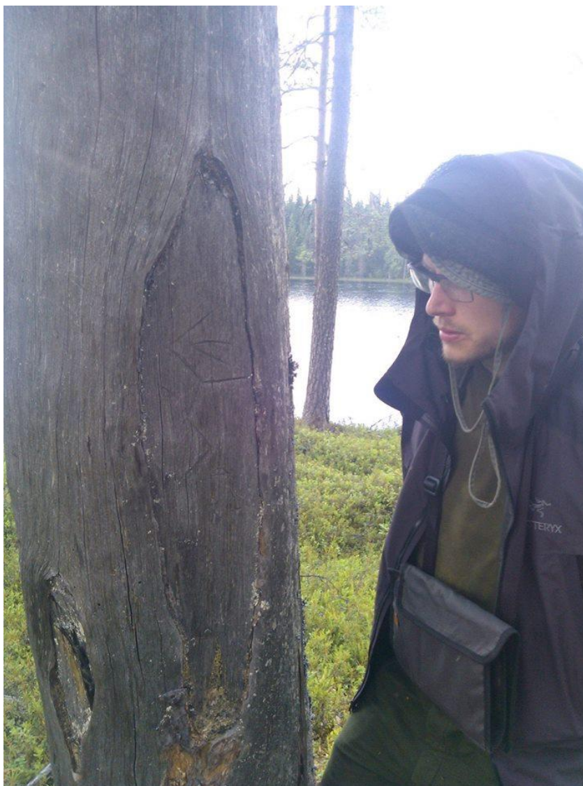
Kuva 2: Karsikkopuu, jossa vuosilukumerkintä ”1818” ja allekirjoittanut. (Lampila 2014)

Kyseessä on karsikkopuu, joita Virmajoen suojelualueelta löytyy kulttuuriperintökohteista tehdyn inventoinnin (Räihälä 2009, 42) perusteella kuusi kappaletta. Karsikkopuuta ei välttämättä osaa nähdä, jos ei tiedä mistä on kyse. Nimenomaisen puun kohdalla, jossa on merkintä 1800-luvun alusta, voi puun pinnalla nähdä salamaa muistuttavan symbolin (kuva2) ja sen alla merkinnän ”1818”.