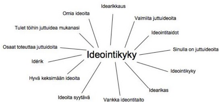
KUVA 1 Luokan Ideointikyky muodostuminen

Käytännössä luokkien muodostaminen tapahtui niin, että värjäsin excel-taulukon soluja erivärisiksi sen mukaan, mihin uuteen luokkaan määre saattaisi mielestäni kuulua. Kehittelin luokkien nimiä sitä mukaa, kun analyysi eteni. Aloitin helpoimmista ja yksiselitteisimmistä määreistä, kuten koulutus ja kokemus, jotka oli usein ilmaistu samalla tavalla. Sitten aloin perata vähemmän selkeitä määreitä tutkimalla, onko niiden välillä yhteyksiä ajatuksen tai sanojen tasolla.