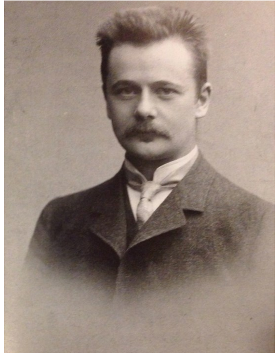
Kuva 1. Paavo Virkkunen 1900-luvun alussa.

Rajaan aiheeni ajallisesti 1800–1900-luvun vaihteeseen, tarkemmin vuosiin 1900–1917. Lisäksi yksi analysoitava teksti ajoittuu 1890-luvun alkuun. Vaikka Virkkusen siveellisyyttä koskevat kirjoitukset ulottuvatkin pitkälle 1920-luvulle ja vielä siitäkin eteenpäin, moraalireformin ja siveellisyysskysymyksen kannalta juuri 1900-luvun alku oli merkittävää aikaa. Pirjo Markkolan mukaan moraalireformin käännekohtana voidaan pitää vuosia 1905–1907, joihin ajoittuivat