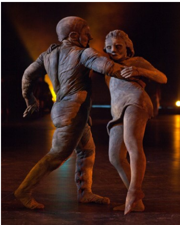
Kuva 2. Tanssivat patsaat.

Vuonna 85:n tapahtumapaikkana toimi Tampereen aito että fiktiivinen kaupunki. Hannu Lindholmin luoma lavastus toi lavalle niin Lokomon tehtaan kuin Hämeensillan patsaat, Pyynikin uimarannan kuin keskustorin.