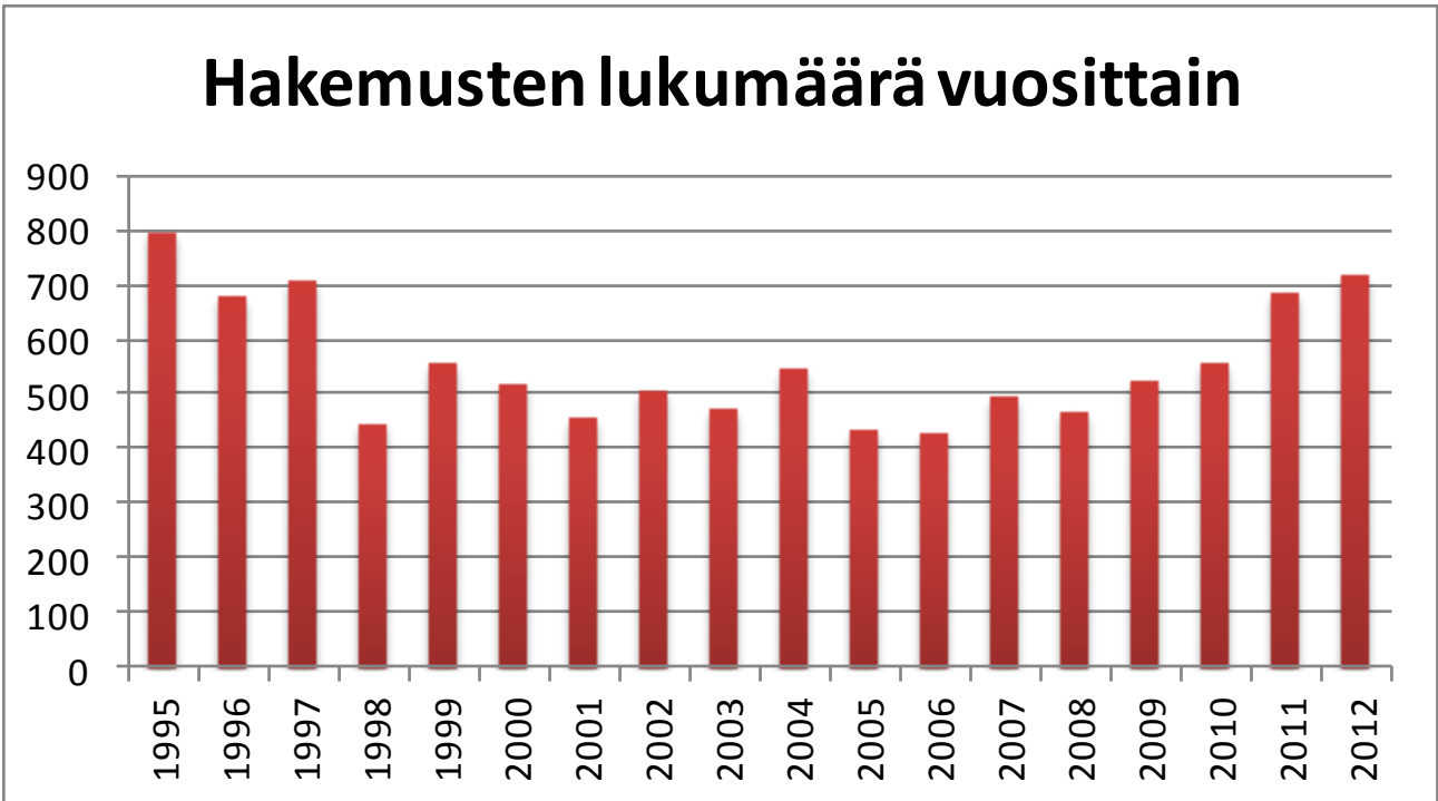
Kuvio 3. Hakeutumisasiivisuus naisten vapaaehtoiseen asepalvelukseen. (Puolustusvoimat 2014.)