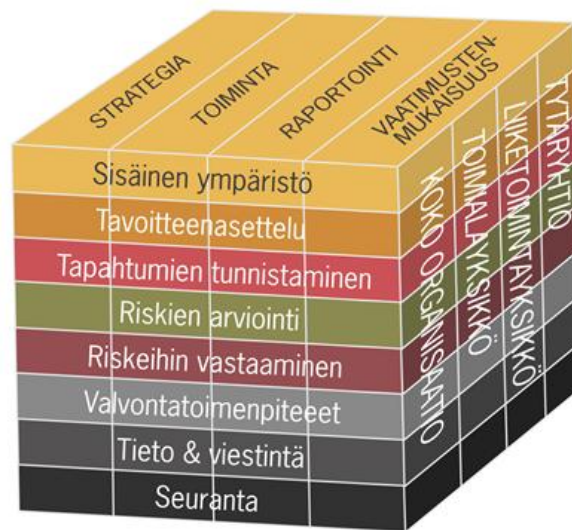
Kuvio 3. COSO-ERM -viitekehys (COSO 2004)

Kuviossa 3 on kuvattuna COSO-ERM -malli (COSO 2004).