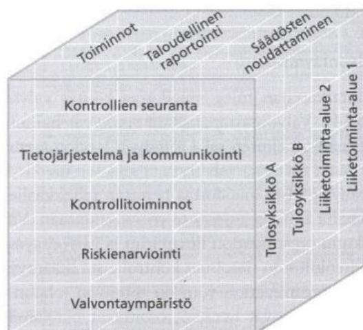
Kuvio 2. Sisäisen valvonnan osatekijät ja tavoitteet COSO -mallin mukaan (Ahokas 2012, 26.)

COSO -viitekehys pitää sisällään viisi eri osatekijää. Nämä viisi eri osatekijää ovat toisiaan yhdistäviä tekijöitä, jotka ovat myös riippuvaisia toisistaan. Osatekijät ovat: (1) valvontaympäristö, (2) riskien arviointi, (3) kontrollit, (4) tiedot ja kommunikointi sekä (5) seuranta. (Mattila 2006, 7.) Lisäksi niin kutsutussa COSO -kuutiossa (Kuvio 2) on annettu sisäisen valvonnan tavoitteet, joita näillä osatekijöillä pyritään toteuttamaan. Nämä tavoitteet ovat sisäisen valvonnan yhteydessä selvitetty: toimintojen tarkoituksenmukaisuus ja tehokkuus, taloudellisen raportoinnin luotettavuus sekä lakien ja sääntöjen noudattaminen. (Ahokas 2012, 25.)