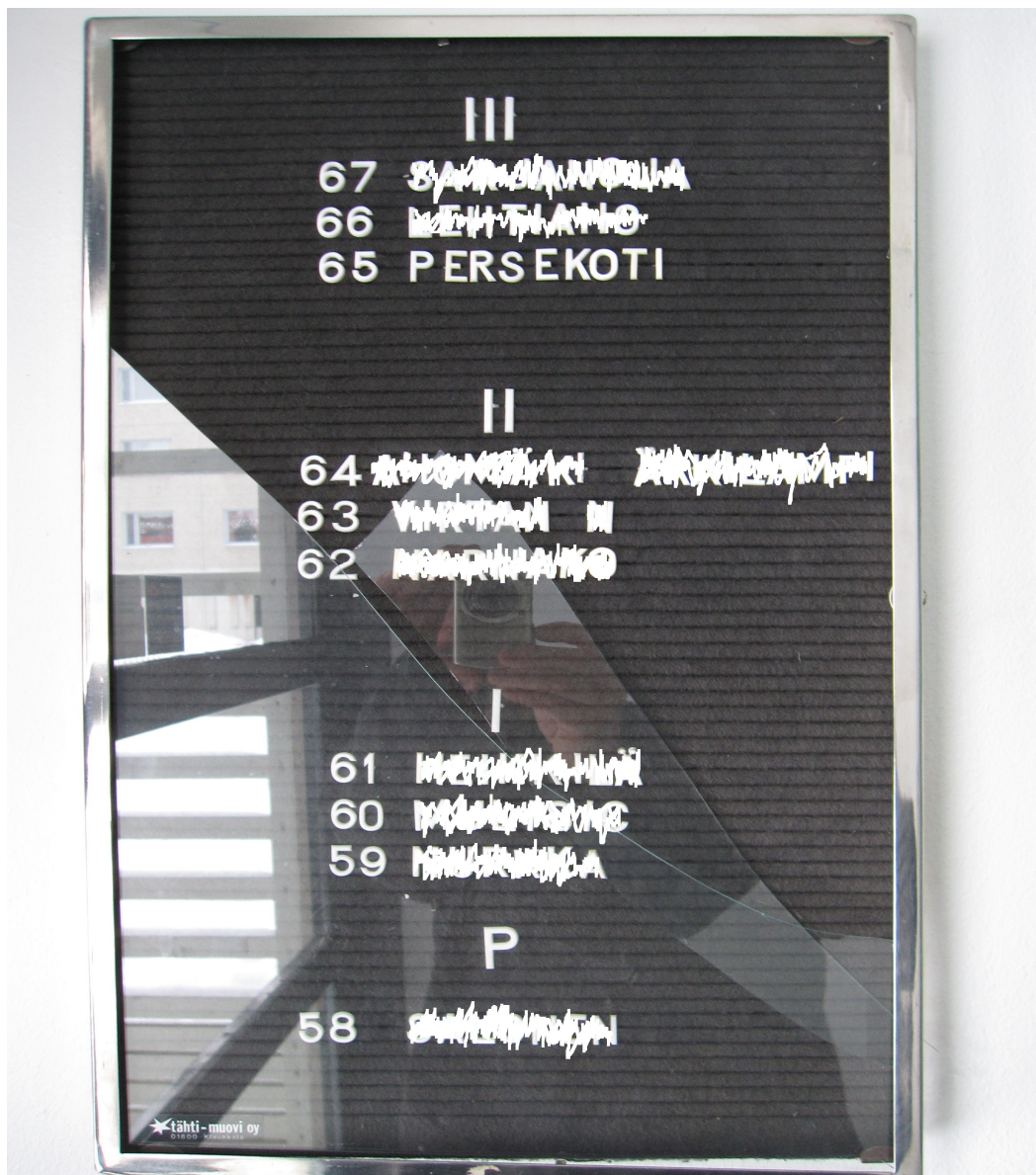
Kuva 1. Sotkettu nimitaulu. (Hakulinen 2013)

Perheryhmäkodin pihapiirissä asuvan henkilön näkyvä rasististen arvojen korostaminen muille asuinalueella eläville ja ilkeältä nimitaulua kohtaan, antavat viitteitä siitä, minkälaisia vihamielisiä haasteita nuoret joutuvat välillä kohtaamaan uudessa ympäristössään. Nuoret olivat kohdanneet muutamia vastaavia tekoja Suomessa asuessaan.