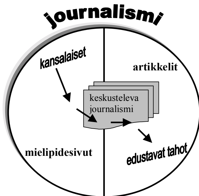
Kuva 8. Journalismin keskustelevuuden paradoksi

Keskustelevuuden edellytyksenä pidetään kansalaisten pääsyä mielipiteineen ja tietoineen yleisönosaston ulkopuolelle vakiintuneiden tiedontuottajien rinnalle – sinne missä on objektiivista tietoa, ei vain subjektiivisia mielipiteitä. Tässä piilee journalismin keskustelevuuden paradoksi. Kun kansalaiset täyttävät journalismin asettamat pääsyn kriteerit ja kelpaavat journalististen artikkeleiden uskottaviksi lähteiksi, lähestytään keskustelevaa journalismia. Journalismin keskustelevuuden perustan kannalta asetelma on kuitenkin ongelmallinen, koska pääsyn kriteereiden täytyessä, niistä kansalaisista, jotka ovat seulan läpäisseet, tulee enemmän tai vähemmän edustavia.