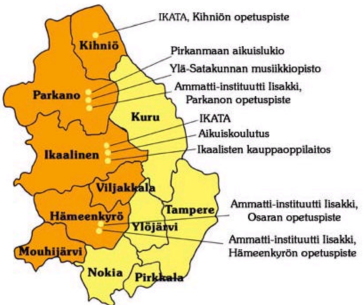
Kuvio 1: Länsi-Pirkanmaan koulutuskuntayhtymän jäsenkunnat ja oppilaitokset ( http://www.lpkky.fi/kartta.html ).