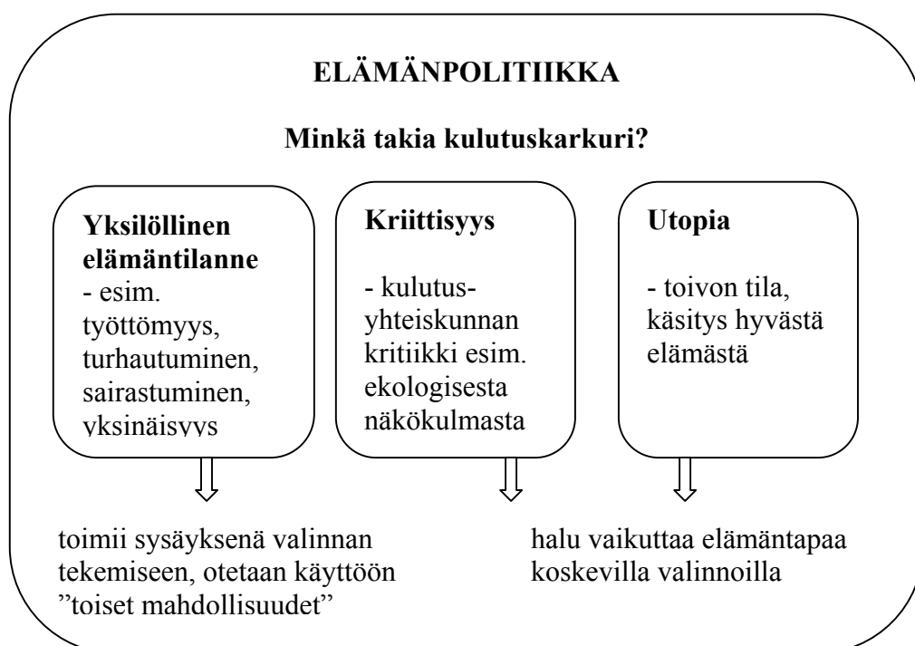
Kuvio 1. Kulutuskarkureiden elämänpoliittiseen valintaan vaikuttavat tekijät.

kulutuskarkuruuden yksilöllisen elämäntilanteen ja sen refleksiivisen arvioinnin seurauksena. Kun yksilö pohtii, miten tulisi elää, hän suuntaa toimintaansa sen mukaisesti. Kulutuskarkuruudessa on ilmeistä, että oman elämän arviointi on yhteydessä vallitsevan järjestelmän kritiikkiin. Kritiikki herättää halun elää toisin, toteuttaa käytännössä omaa käsitystään paremmasta elämästä. Kritiikin lisäksi käsitys paremmasta, utopia, voi olla elämäntapavalinnan vaikuttimena. (Kuvio 1)