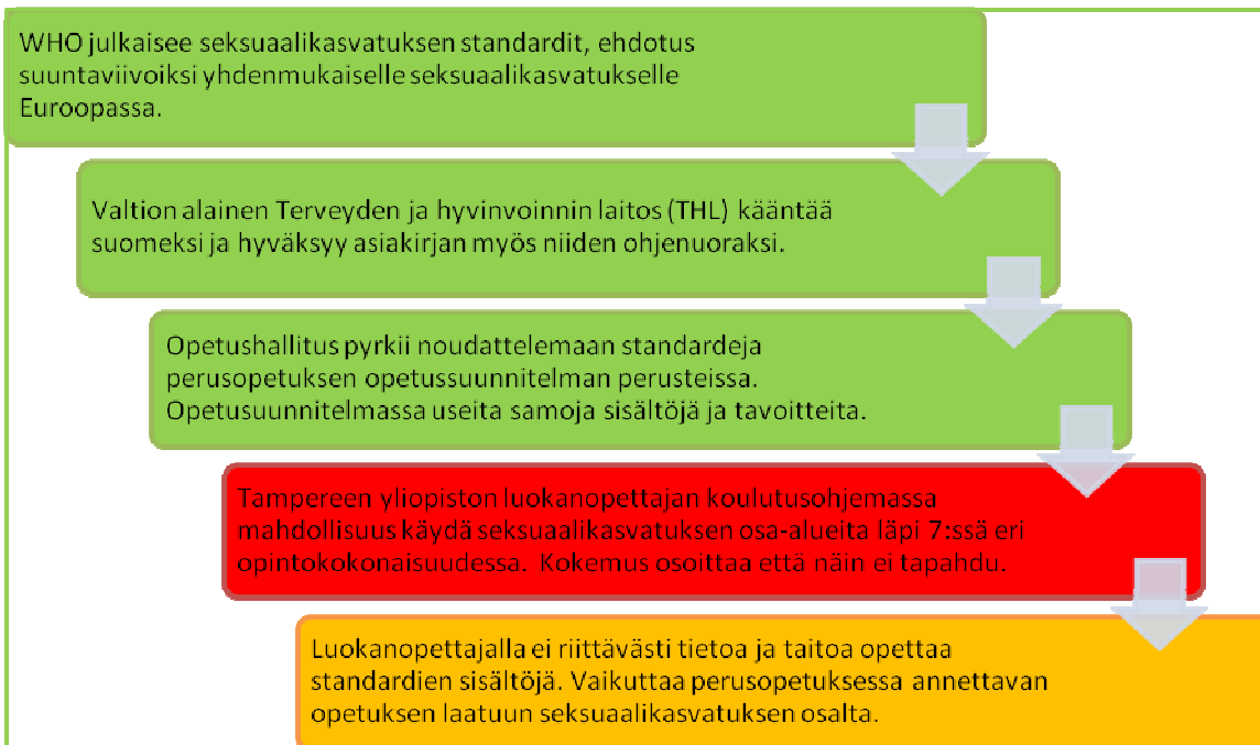
Kuva2, Koulutuksen vaikutus seksuaalikasvatukseen.

Se, että perusopetuksen opetussuunnitelma sisältää huomattavasti enemmän sisältöjä ja tavoitteita seksuaalikasvatuksesta, kuin mitä luokanopettajakoulutus antaa valmiuksia opettaa on merkittävä ongelma, sillä opettajien on pystyttävä peruskoulutuksensa ja/tai täydennyskoulutuksen avulla takaamaan laadukas opetuksen taso, jotta oppilaat voivat hankkia tietoja ja taitoja pystyäkseen toimimaan kansalaisina ja työntekijöinä (EU komissio 2013). Voidaan ajatella, että opettajakoulutuksessa on laatuvirhe, jota Deming on kutsunut erityisistä syistä johtuviksi laatuvirheiksi . Tämä voi johtua jälkeen jääneestä toimintaideasta, tehottomasta ajankäytöstä tai riittämättömästä tai ammattitaidottomasta henkilökunnasta. Nämä ongelmakohdat voidaan korjata vain johdon toiminnan avulla. (Raivola 2000, 28–29.) Tässä tapauksessa se tarkoittaisi opintokokonaisuuksien tarkastelua seksuaalikasvatuksen näkökulmasta johdon toimesta, sekä mahdollisia muutoksia koulutuksen sisältöihin, jolloin tulevat luokanopettajat saisivat paremmat tiedot ja taidot seksuaalikasvatuksen opettamiseen.