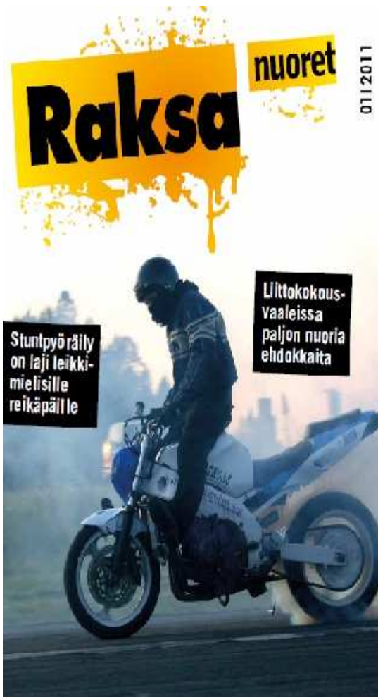
kuva1: Raksanuoret 01/2011 -numeron kansi.