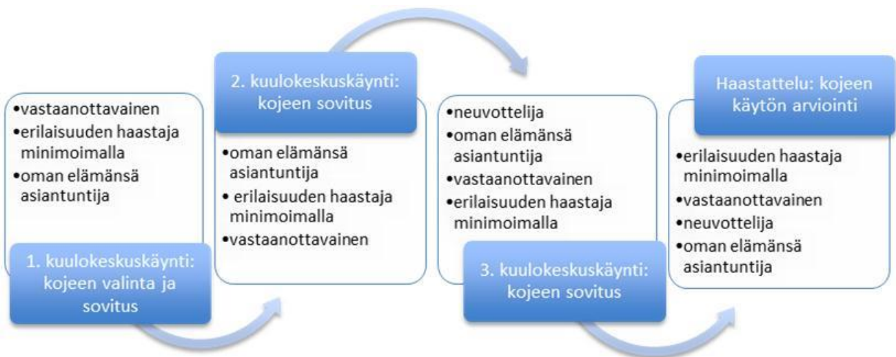
Kuvio 4: Juhon kuntoutumispolku

Haastattelun aikana Juho tuo vielä esille tietämystään siitä, millaisissa tilanteissa hän kuulokojetta tarvitsee. Esimerkiksi, kun hän keskustelelee yhden ihmisen kanssa, hän kuulee ihan hyvin: jos niinku, niinku periaatteessa tapaa vaan yhtä ihmistä niin silloin en tartte kojetta koska ei oo mitään vaikeuksia (H009HA). Lomalla ollessaan Juho ei myöskään tarvitse kojetta: osittain siitä syystä että niissä olosuhteissa missä olin niin en tarvii. Ehkä, ehkä se suurin syy just minkä takia en tarvii ni tein paljon semmosta kaikkee mökillä ollessani jossa on.. ajoin leikkuria, pienempää ruohonleikkuria, kaikennäkösiä koneita ni ei silloin tarvii kuulokojeita. (---) Myöskin kun pärjään ilmankin niin, kyl mä sitä vähän pidin, mutta vähän siitä ajasta. (H009HA) Juho kertoo käyttävänsä kuulokojeita tilanteen mukaan ja tietää tulevansa toimeen myös ilman niitä. Kerronta ilmentää oman elämänsä asiantuntijaksi positiointia.