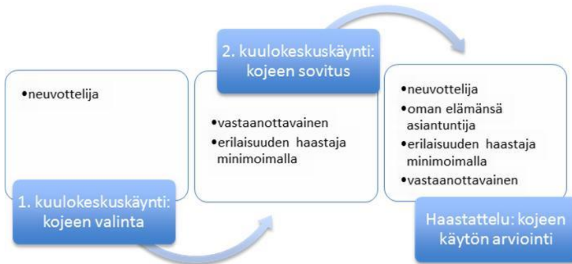
Kuvio 2: Pekan kuntoutumispolku

Sosiaalisissa tilanteissa, joissa muut ihmiset eivät ole sanoneet mitään Pekan kuulokojeen käytöstä, Pekka kertoo ottaneen asian itse esille. Tulkitsen muille kuulokojeesta kertomisen sosiaalisessa tilanteessa esimerkkinä pyrkimyksestä haastaa kuulokojeen käyttöön liittyvä poikkeavuus. Toimimalla tällä tavoin Pekka osoittaa muille, että sen käyttäminen on ihan tavallista ja siitä voidaan jopa hyötyä kuulemalla paremmin. Pekka kertoo aineisto-otteesta havaitsemastaan tilanteesta, jossa hänelle aletaan puhua kuuluvalla äänellä, kun hänen huomataan käyttävän kuulokojetta. Pekka toteaa kertoneensa vuorovaikutuskumppanilleen, että ei hänelle enää tarvitse korottaa ääntä, koska hän käyttää kuulokojetta. Katson Pekan kuvaavan puheenvuorossaan kuulokojeen mukanaan tuomaa muutosta hänen elämäänsä. Ennen kuulokojeen käyttöönottoa hänelle olisi pitänyt puhua kuuluvalla äänellä, mutta nyt ei enää tarvitse, koska kuulokojeen avulla hänen on mahdollista kuulla normaalisti.