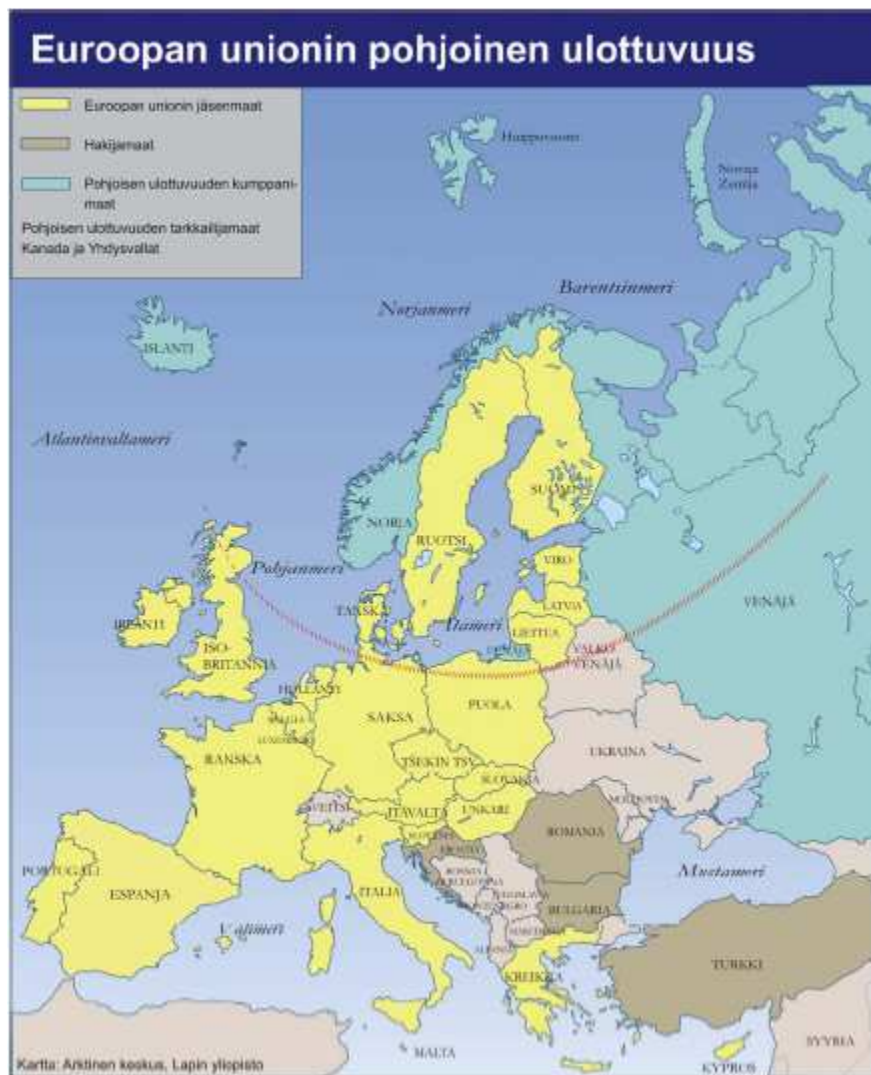
Kuvio 1. Pohjoinen ulottuvuus kartalla (Lapin yliopiston Arktinen keskus 2006).

EU:n pohjoista ulottuvuutta kuvataan usein esimerkiksi Suomen ulkoministeriön julkaisuissa Euroopan kartalla, johon on merkitty EU-jäsenmaat, hakijamaat ja PU-kumppanuusmaat (Kuvio 1). Se, että kartalla on koko Eurooppa eikä vain sen pohjoisia osia korostaa pohjoista ulottuvuutta koko EU:n yhteisenä hankkeena. Pohjoisen ulottuvuuden toiminta-alueita kuvaamaan piirretään kaari, joka leikkaa suurpiirteisesti itämeren eteläpuolelta. Kaari osoittaa pohjoisen ulottuvuuden toiminnallisen ytimen, mutta ei erota sitä selkeästi muusta Euroopasta.