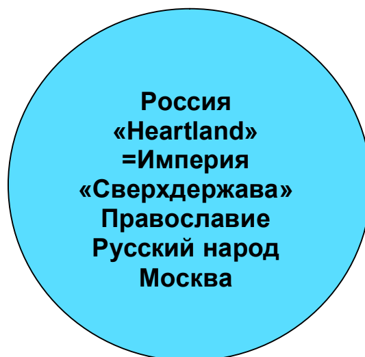
Рисунок 4. Суть Евразии

Названные нами факторы (центр, санитарный кордон и стратегические союзники) формируют «воображаемую евразийскую Империю». В самом центре, данной Империи конечно, Россия-Евразия, «Heartland» и ее союзы и союзники. Они, согласно Дугину, являются главными деятелями «Новой Империи». Суть Евразии изображена в следующей картине.