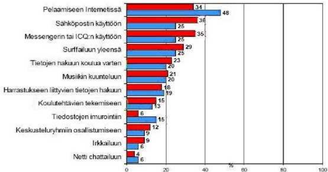
Taulukko 2: Tilasto poikien ja tyttöjen tietokoneen käytöstä.

Sanomalehtien Liiton Taloustutkimus Oy:llä teettämän nuorison mediankäyttötutkimuksen (2007) mukaan nuorten keskuudessa internet on noussut tärkeimmäksi ja mieluisimmaksi tiedotusvälineeksi. Internet oli ohittanut television sekä mieluisuudessa että tärkeydessä, ja internetin arvostuksen ja mieluisuuden nouseva trendi on jatkunut jo vuodesta 1995 lähtien.