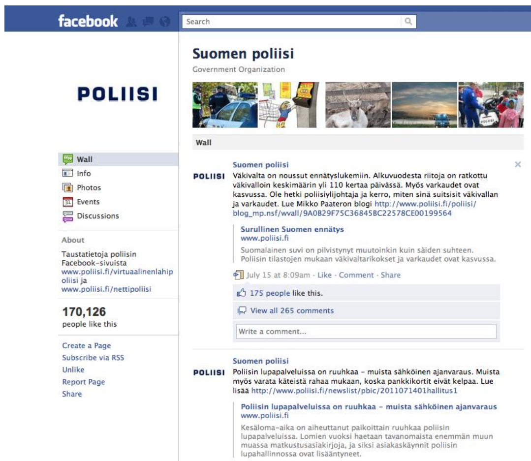
Kuva 3. Suomen poliisin Facebook-sivu.

kansalaisten kynnystä ottaa yhteyttä poliisiin. Sivujen tarkoituksena on toimia siten rikoksia ennaltaehkäisevästi. Koko poliisihallinto esittäytyy Facebookissa yhden Suomen poliisi -profiilin kautta. (www.poliisi.fi.)