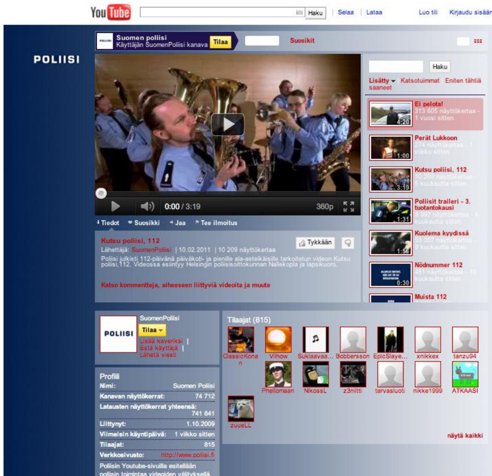
Kuva 4. Suomen poliisin YouTube-kanava.

Suomen poliisilla on YouTubessa oma kanava nimellä Suomenpoliisi (www.youtube.com/suomenpoliisi). YouTuben hyödyntäminen poliisin viestinnässä on osa poliisin viestintästrategian mukaista viestintää. Youtubessa poliisin videoita on katsottu satoja tuhansia kertoja (Poliisihallitus 2010, 20). Vuoden 2010 loppuun mennessä poliisin ennaltaehkäiseviä videoita oli katsottu YouTube-palvelussa lähes 600 000 kertaa (Poliisihallitus 2011, 23). Ennaltaehkäisevän materiaalin lisäksi palvelusta löytyy Poliisit tv-sarjojen trailereita.