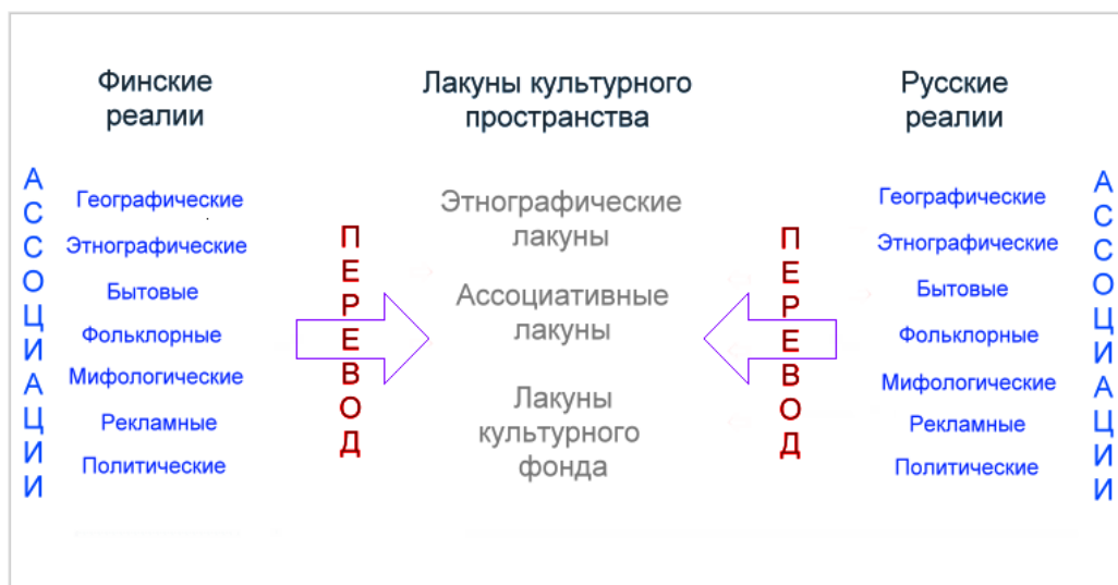
Схема 1. Лакуны культурного пространства в переводе.

Согласно А.Д. Швейцеру (1988: 80) значительную часть культурного фонда любой культуры составляют собственные имена исторических деятелей, поэтов, писателей, художников, популярных литературных героев и героев фольклора. При переводе текстов, содержащих эту часть культурного фонда, как правило, возникают ассоциативные лакуны (см. Схему 1).