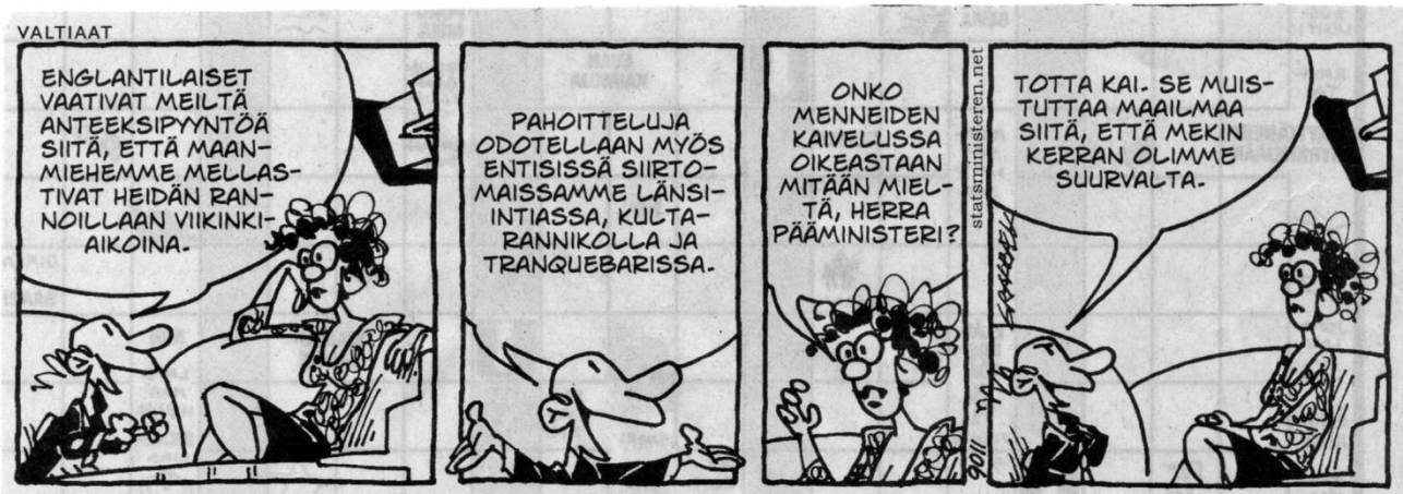
Kuva 1. Helsingin Sanomat 31.7.2009.

Oheinen sarjakuva johdattelee muistin politiikan äärelle, vaikkei tutkielman fyysiseen kohteeseen, Karjalaan muuten liitykään. Sarjakuva kiteyttää osittain sen, mitä muistin politiikalla itse ymmärrän, ja siksi valitsin sen ajattelun 'herättelijäksi'.