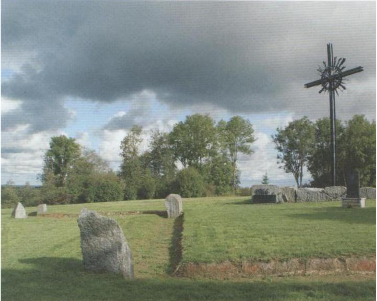
Kuva 2. Tourneelle! –esitteen Karjalan matkojen kuvitusta

Kuva-analyysiin valitsin esitteestä kuvan, jossa esitetään muistomerkkialue luonnon keskellä, kukkulamaisella paikalla. Suuri rautaristi ja kivipaadet sen ympärillä viestivät arvokkuutta ja vakavuutta. Tummat pilvet taivaalla, juuri alueen päällä korostavat paikan synkkyyttä, vaikka aurinko paistaakin. Myös varjot luovat kuvaan tunnelmaa, joka välittyy tummana vihreän luonnon keskellä. Rautaristin alla olevaan kivipaateen on kiinnitetty vuosiluku 1944 ja laatta, jonka tekstistä ei kuvasta saa selvää. Ristin välittömässä läheisyydessä on muistomerkki, jonka juurelle on istutettu pieni kukka. Kukkulan nurmialueella kulkee myös pengerretty syvennys, joka muistuttaa polkua, mutta jota ei juuri ole kuljettu. Syvennystä reunustavat harvaan asetellut niin ikään paasimaiset kivet. Yleisvaikutelma kuvasta on toisaalta rauhallinen, jopa odottava, mutta toisaalta synkkä ja surullinen. Kuvan symboliikka keskittyy vahvasti ristiin, joka on kristinuskon symboli,