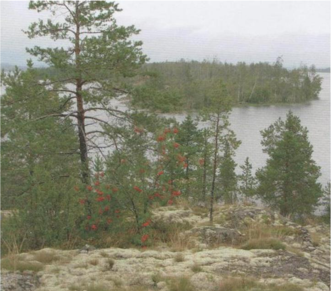
Kuva 3. Tourneelle! –esitteen Karjalan matkojen kuvitusta.

Kuvassa on harmaa, syksyinen maisema, jossa lehtipuut ovat jo pudottaneet lehtensä, tai niitä ei kuvassa näy. Kuva on otettu kalliolta, jossa kasvaa sammalta ja alhaalla siintää järvi, jossa on saari tai niemen kärki. Kalliolla on pihlaja, jossa punaiset marjat painavat pensaan oksia alaspäin. Kuvaa hallitsee mänty, joka kasvaa järveen laskevan rinteän alkupuolella. Sää on kolea, mutta tyynen oloinen, sillä järven pinta on tynekö ja puiden oksat eivät vaikuta tuulessa taipuneilta. Pilven tummahko reuna taivaalla antaa viitteitä poistuvasta tai saapuvasta sateesta.