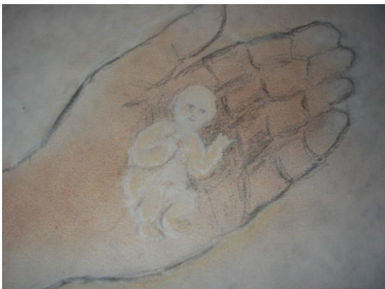
Kuva 5. Uni II.

Viimeinen kuva on syntynyt haastattelujakson lopussa. Minun on ollut vaikea löytää sanoja tälle unikuvalle. Ehkä se kertoo jotakin siitä, miten tärkeää lapsista huolehtiminen on ja miten lapset ovat aikuisen huolenpidon varassa.