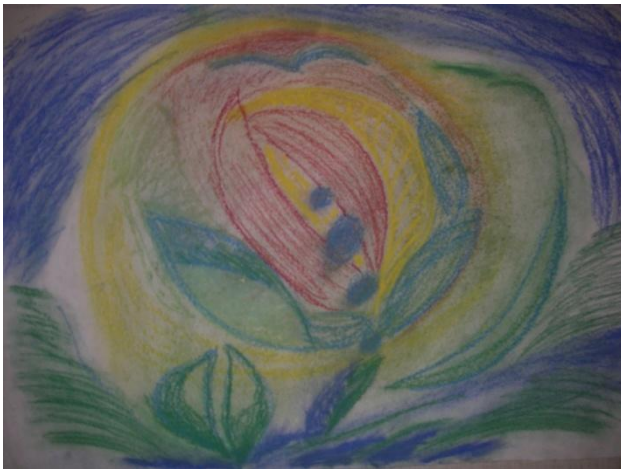
Kuva 3. Etsimistä.

pitäisi rajata ja miten jatkaa. Kuvan tekemistä aloittaessani en tiennyt, millainen kuva siitä syntyisi. Ajattelen, että sen tekemisessä toimin enemmän alitajuisesti kuin tietoisesti. Viiva lähti liikkeelle käteni kautta ja värit ilmestyivät paperille intuitiivisesti. Tekemisen hetki oli intensiivinen ja olin keskittynyt näkemään, mitä kuvan syntymisessä tapahtuu. (Ks. Case & Dalley 1997, 97.)