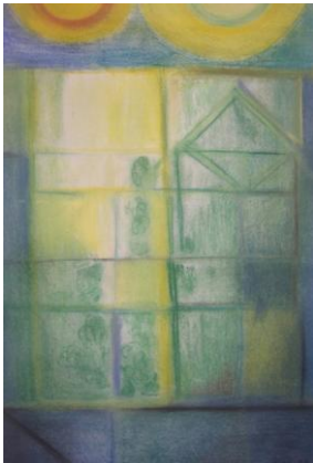
Kuva 1. Miten tutkimusta rakennetaan?

Sosiaalityön sateenkaaren alle mahtuu hyvin erilaisia tutkimussuuntia toimeentuloturvasta psykososiaaliseen työhön ja yhteisölliseen kehittämiseen. Minun työni seksuaalisesti hyväksikäytettyjen lasten kuvataideterapeuttisesta auttamisesta sijoittuu sen sateenvarjon alle psykososiaalisen työn alueelle.