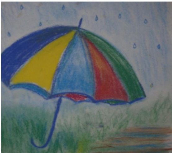
Kuva 2. Sosiaalityön sateenvarjo.

Sosiaalityön sateenkaaren alle mahtuu hyvin erilaisia tutkimussuuntia toimeentuloturvasta psykososiaaliseen työhön ja yhteisölliseen kehittämiseen. Minun työni seksuaalisesti hyväksikäytettyjen lasten kuvataideterapeuttisesta auttamisesta sijoittuu sen sateenvarjon alle psykososiaalisen työn alueelle.