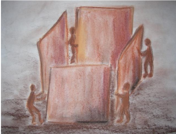
Kuva 4. Uni I.

Viimeinen kuva on syntynyt haastattelujakson lopussa. Minun on ollut vaikea löytää sanoja tälle unikuvalle. Ehkä se kertoo jotakin siitä, miten tärkeää lapsista huolehtiminen on ja miten lapset ovat aikuisen huolenpidon varassa.