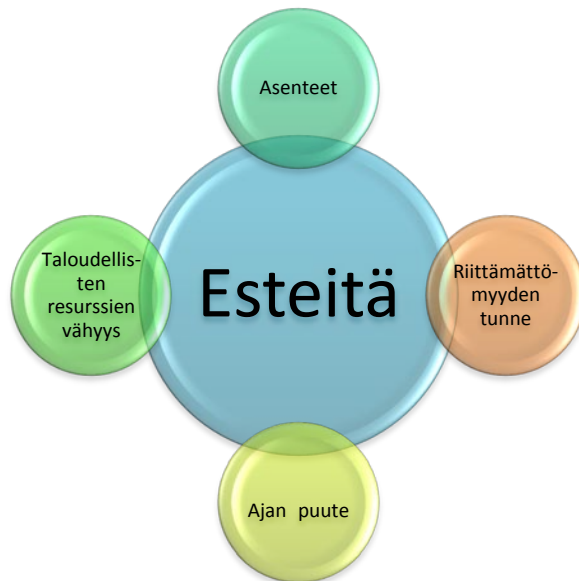
KUVIO 1. Inklusioprosessin esteitä.

Kuviossa 1 on kuvattu tässä tutkimuksessa esiin tulleita esteitä haastateltavien näkökulmasta. Inklusioprosessin ensisijaiseksi esteeksi haastateltavat näkivät taloudellisten resurssien vähyyden ja siitä johtuen tarpeellisten tukitoimien puuttumisen. Muita esteitä olivat asenteet, ajan puute ja muut aikatauluongelmat sekä opettajien riittämättömyyden tunne.