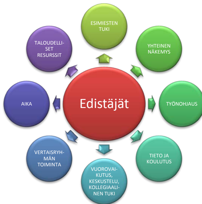
KUVIO 2. Inklusioprosessin edistäjät.