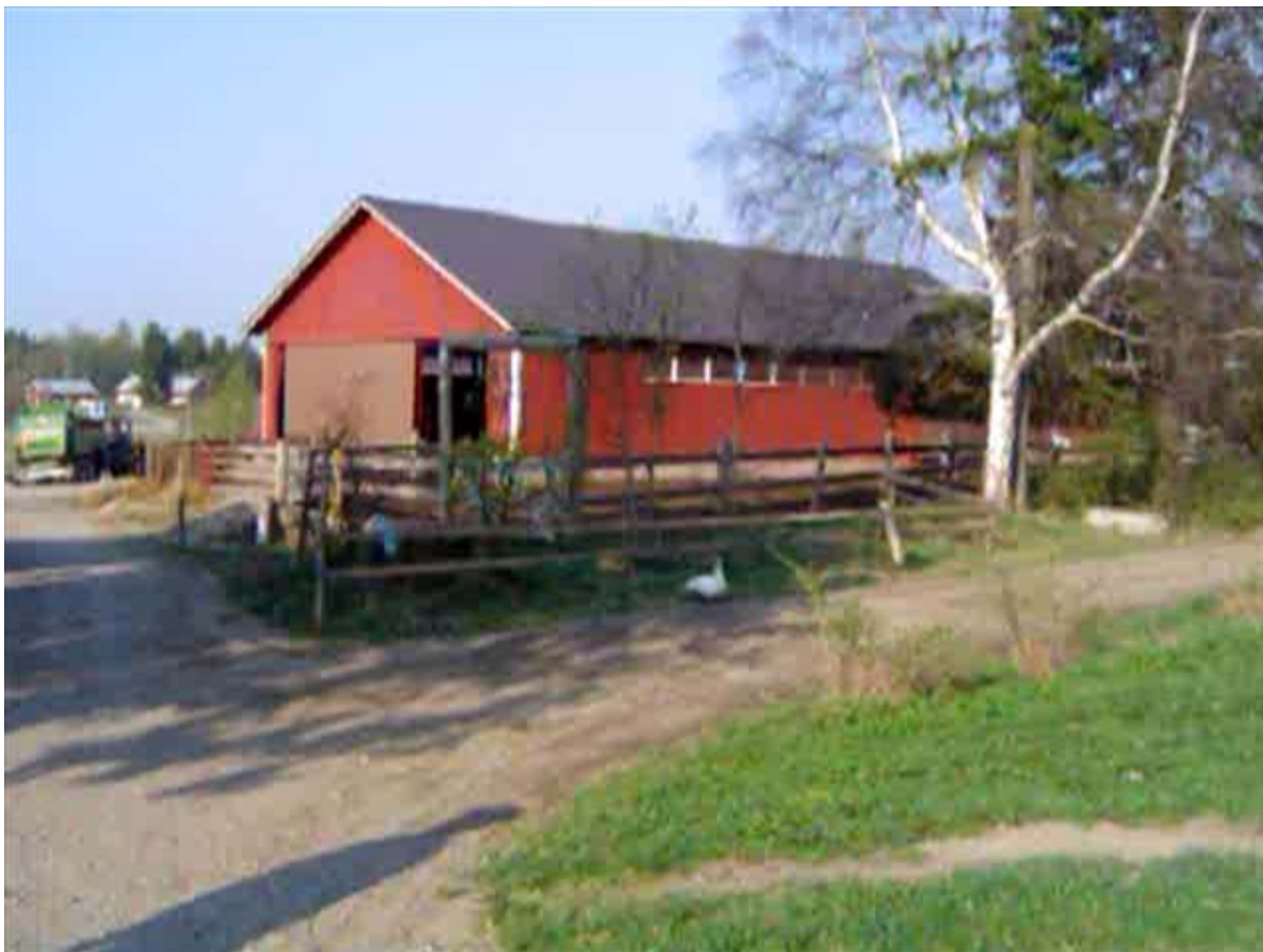
Kuva 1: Otos Väinälän takapihalta. Kaukana taustalla siintää yksi asuintaloista ja juhlasali.

Yhteyshenkilöni painottaa yhteisössä asumisen olevan elämäntapa. Hän kertoo, että maailmanlaajuisesti suurin osa yhteisön yksiköistä on aikuisille tarkoitettuja kyläyhteisöjä, ainoastaan 13 niistä on lapsille ja nuorille suunnattuja kouluyhteisöjä. Kyläyhteisöissä korostuu tasa-arvoisuus ja kouluyhteisöissä kasvatuksellisuus.