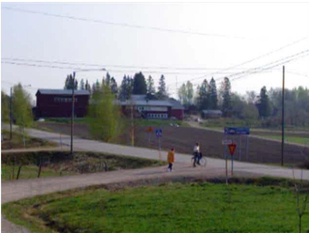
Kuva 5: Risteys, joka jakaa tilan kahteen osaan.