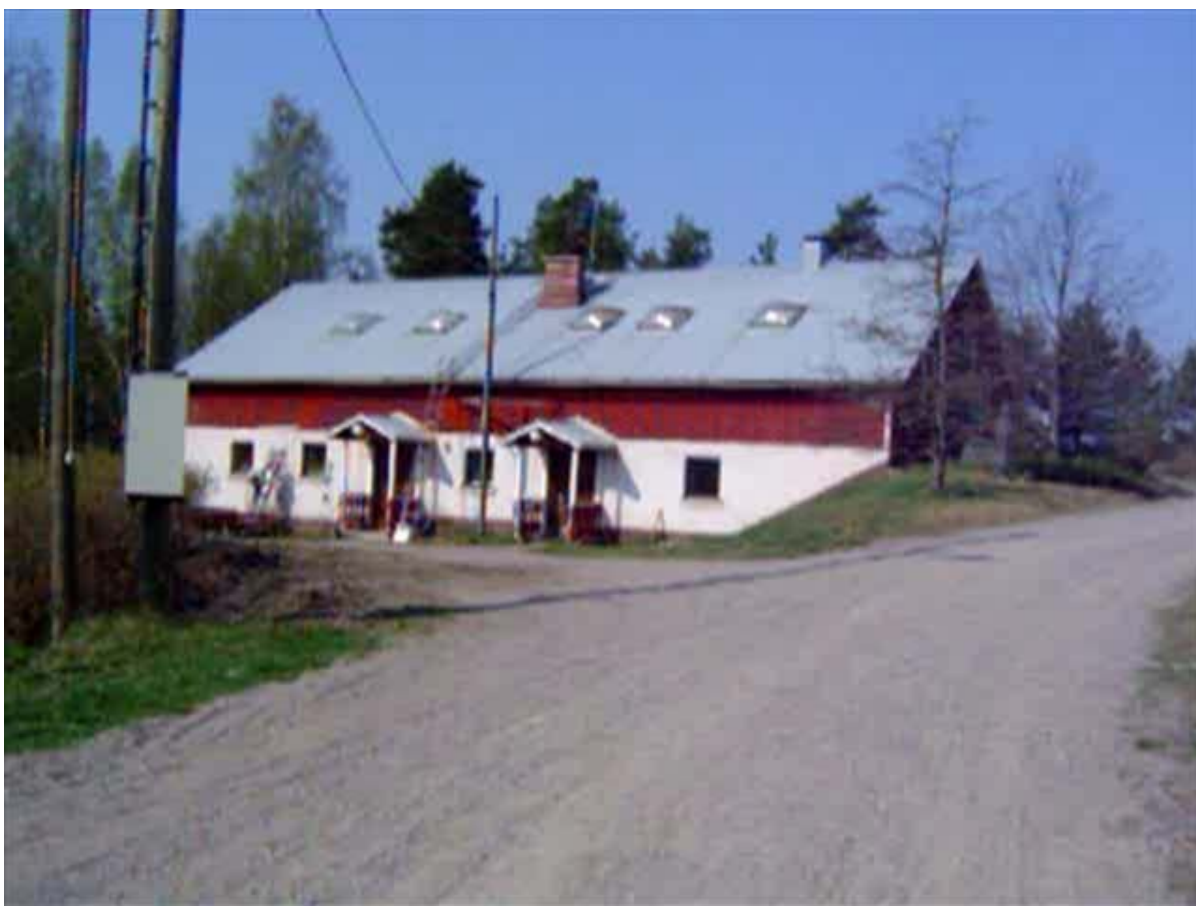
Kuva 3: Vanha navetta, jonka yläkertaan tehdyn juhlasalin kirjastohuoneessa oli majoitustilani.

Yhteyshenkilöni pyytää minut kiertoajelulle, johon osallistuvat myös edellisenä päivänä Tapolaan tulleet vapaaehtoistyöntekijät, tsekkiläinen poika ja espanjalainen tyttö sekä kaksi 15-vuotiasta suomalaispoikaa, jotka ovat yhteisössä suorittamassa Steiner-koulun maatilaharjoittelua. Lähdemme toimistorakennukselta ja kierrämme katsomassa muut Tapolan rakennukset ja tilaan kuuluvia metsiä ja peltoja. Yhteyshenkilö kertoo, että tilaan on ajan kuluessa liitetty viereisiä taloja ja yhteisön alue on laajentunut sitä kautta. Hän esittelee yhteisön työpajoja - navettaa, puutarhaa, kutomoa, juustola - ja kertoo, että yhteisössä on ollut aiemmin muun muassa leipomo, nyt taas uutena työpajana ollaan aloittamassa kahvilatoimintaa. Yhteisön kalevalaiseen tapaan nimetyissä asuintaloissa Väinälässä, Antero Vipusessa, Kaukamossa, Taavetissa, Seppolassa ja Kalliossa on lisäksi taloustöihin liittyviä talotyöpajoja.