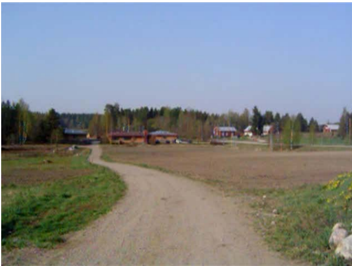
Kuva 2:Näkymä Väinälän takapihalta toimistorakennukselle ja osalle asuintaloja

Rukouksen päätteeksi otamme vierustoveria kädestä kiinni, heilautamme kättä ja toivotamme toisillemme hyvää ruokahalua. Ruoan tarjoilee ja annostelee pöydän päässä istuva ”talon isä”. Kukaan ei lähde itse hakemaan ruokaa pöydän päästä, vaan lautanen pannaan eteenpäin aina vierustoverille. Ruoka on hyvää, juusto väkevää, yhteisön omassa juustolassa valmistettua. Ruokailutilanne on harras ja muodollinen, mutta pöydässä istuvat kyläläiset ovat kuin kotonaan.