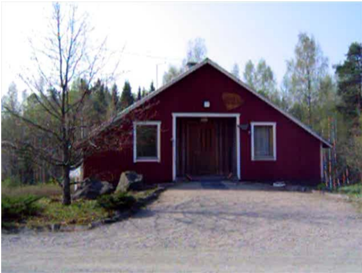
Kuva 6: Juhlasalin sisäänkäynti

puhumaan mielummin englantia. Taideterapeutti käyttää puheessaan minulle vierasta antroposofista terminologiaa, hän puhuu ”impulssin kantamisesta” ja ”biodynaamisesta viljelystä”.