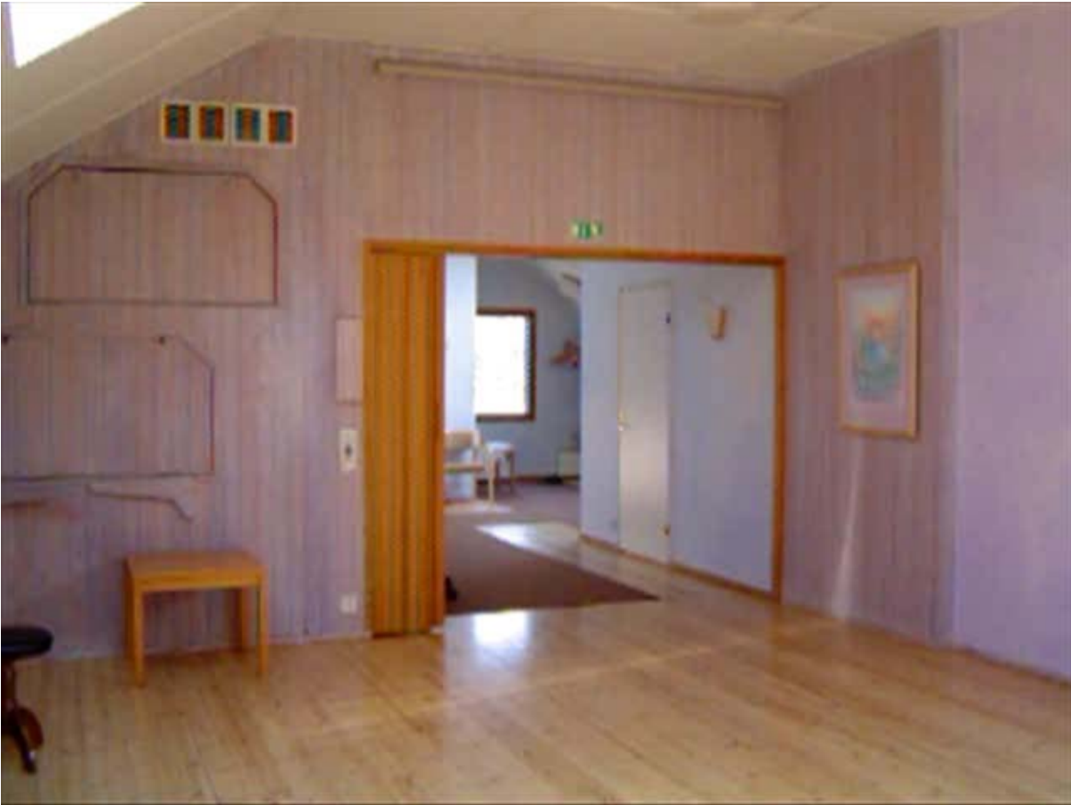
Kuva 4: Otos juhlasalista kirjastohuoneen ovelle. Seinällä vesivärimaalaus.

antroposofiseen tapaan harmonisin värein maalattuun vesiväriyöhön. Kyläläiset ovat työpajoissaan ja minulla on aikaa tutustua Tapola-lehtiin ja yhteyshenkilön minulle antamaan Camphill-yhteisöstä kertovaan kirjaan nimeltä A Candle on the Hill. Päätäni särkee, kun en ole saanut kahvia. Löydän salin keittiötilasta teetä ja pannun ja keitän sitä itselleni.