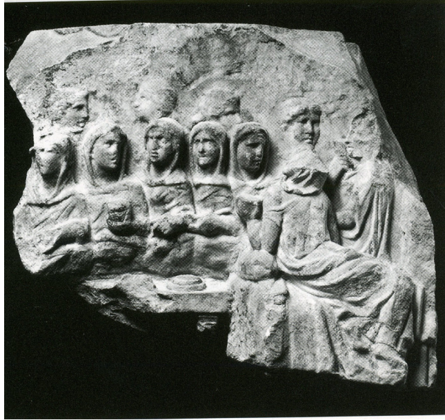
Kuva 5. Kuva on 1900-luvun alusta Rooman forumilta, Atrium Vestae . Mekacher 2006, 141.