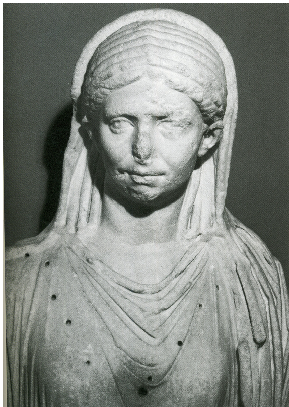
Kuva 7. Iältään vanhempaa vestaalia esittävä patsas, Rooma Antiquario Forense Inv. 424931. Mekacher 2006, 241.