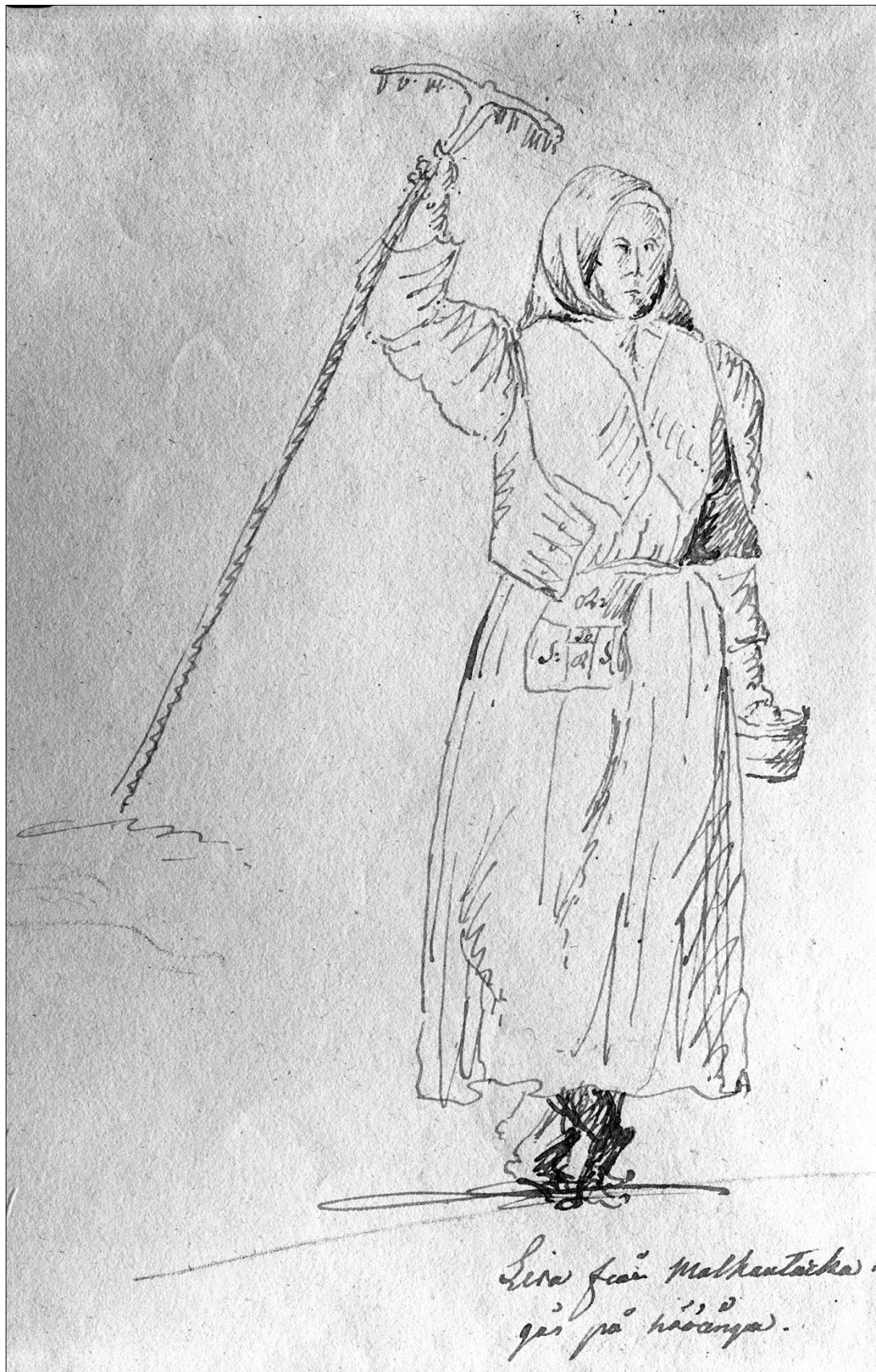
Hauhon Matkantaan Liisa menossa heinäniitylle 1807. Piirros K.G. Ramsay, Museovirasto.