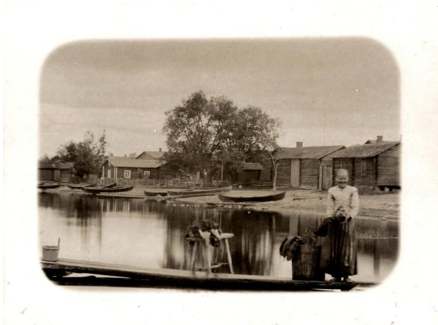
Kuva 3. Hauhon Vitsiälän kylä säilyi samalla paikalla tiiviinä ryhmäkylänä aina 1900-luvun alkuun asti. Kuva: Hauho-Seuran arkisto, VII 7: 147.

Näin muodostui useita pieniä ruokakuntia, jotka kuitenkin olivat sukusidoksissa toisiinsa. Yhteisö pyrki muodostamaan suvun ja heimon, joka muodosti samalla turvaverkon. Tiiviissä ryhmäkylässä voitiin ainakin periaatteessa elää myös suurperheen tavoin, vaikka samaan aikaan oltiin viranomaisten luomissa verotusasiakirjoissa jakaantuneina perhekunnittain useammalle eri tilalle eli ”savulle” kuten 1500-luvun verotuksellinen termi kuului. Väenotto kohdistui tällöin tasaisemmin koko yhteisöön ja samoin verotus. Maa oli verotuksen perusta ja maanluontoa korostettiin asiakirjoissa, samoin kuin sitä ketkä tällä ”maalla” asuivat. Talojen maantieteellinen sijainti, ulkonäkö ja yhden tilan rakennusten määrä oli verotusasiakirjoissa toissijaista.