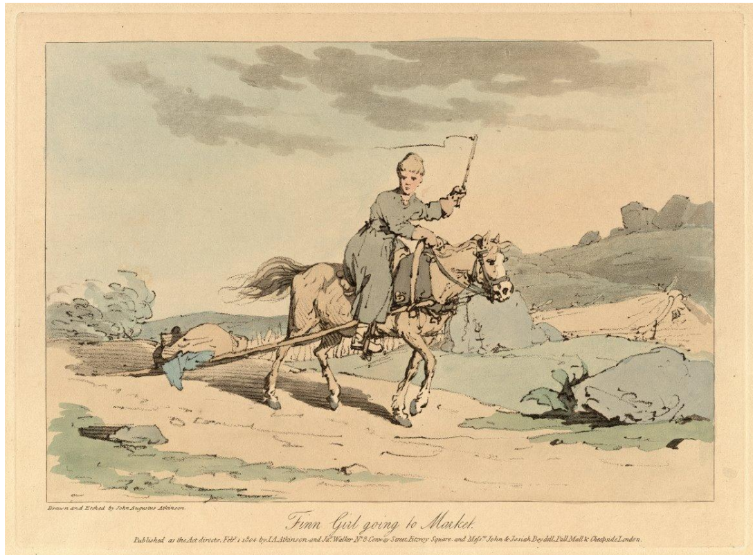
Kuva 7. Suomalainen tyttö matkalla markkinoille. Suomessa matkannut englantilainen John Augustus Atkinson julkaisi piirtämänsä kuvan vuonna 1804.