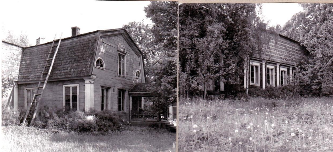
Kuva 8. Hyömäen kartanon 1900-luvulla purettu päärakennus edusti 1700-luvun lopun ja 1800-luvun alun hämäläistä herraskartanoa. Kartanon omisti 1600- ja 1700-luvuilla von Kraemer -suku.