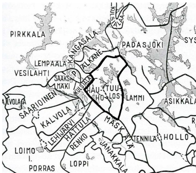
Kuva 2. Verotukselliset asiakirjat 1500- ja 1600-luvuilla noudattavat hallintopitäjäjakoa, joka Hämeessä erosi oleellisesti seurakuntajakoista.

Keskityn tutkimuksessani 1700-luvun osalta vain vuosisadan lopulle. Suuri Pohjan sota, isoviha ja miehitysaika yhdistettynä 1600-luvun lopun nälkävuosiin loivat poikkeustilanteen, joka alkoi 1690-luvulta ja jatkui lähes 1700-luvun puoliväliin asti. Väestökirjanpito oli tuona aikana katkonaista ja puutteellista. Normaalitylanteeseen päästiin vasta 1730-luvulta lähtien. Väestönkasvu nopeutui sen jälkeen Suomessa ennen näkemättömäksi, joten tutkimuksessa keskitytään 1700-luvun lopulla ainoastaan Hauhon pitäjään. Pitäjän pohjoisosaa erikseen kutsuttiin Luopioisten kappeliksi, joka sen seurauksena sai oman väestökirjanpidon. Samoin Tuuloksen kappeli eriytyi yhä enemmän omaksi seurakunnaksi, jolla oli oma väestökirjanpito. Molemmista kappelista muutti väkeä emäseurakuntaan Hauholle ja päinvastoin.