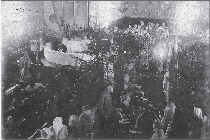
Sankarihautajaiset Jurvan kirkossa heinäkuussa 1918.