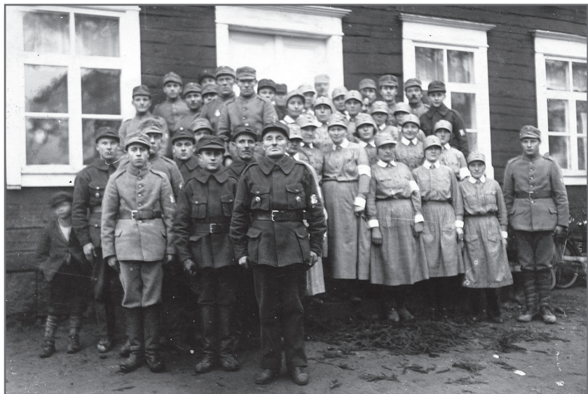
1920-luvun lopulla suojeluskunta ja lottaosasto toimivat tiiviisti yhteistyössä.

kuttajia. Esimerkiksi vuoden 1924 kesäjuhlien puhujana oli kirjailija ja toimittaja Artturi Leinonen. 271 Varsin tyyppillinen vakavahenkisempi suojeluskuntajuhla kulki oheisen esimerkin kaltaisesti. Siinä kuvastuu hyvin myös lottien ja suojeluskuntalaisten sukupuolijärjestys: