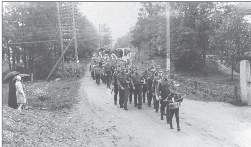
Suojeluskuntaväen marssit ja paraatit olivat tuttu näky maalaiskylienkin raiteilla 1930-luvulla. Tässä suojeluskuntapoikien leiripäivien paraati Ähtärissä vuonna 1931.