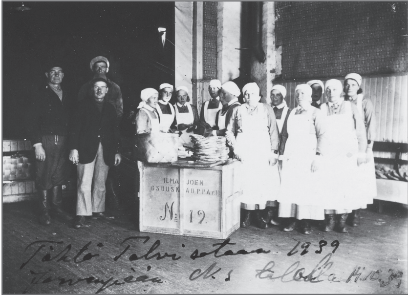
Lotat huolehtivat Järvenpään nuorisoseuralle kokoontuneista reserviläisistä YH:n alkaessa lokakuun puolivälissä 1939.

ajalta. 8 Etelä-Pohjanmaan ankarimmat pommitukset koki juuri satama- ja teollisuuskaupunki Vaasa, jota pommitettiin talvisodan aikana kuusi kertaa. Kaikkiaan Neuvostoarmeija pommitti 12 etelä-pohjalaista paikkakuntaa talvisodassa. 9 Talvisodan alkaessa raportoitiin suojeluskunnan pöytäkirjassa seuraavasti: ”Sotatilän johdosta huolimatta vallitsi paikkakunnallamme väestössä erittäin luja ja innostunut mieliala. Kukaan ei tahtonut vetäytyä syrjään kotirintamalla maanpuolustuksen auttamisessa. Uhrautuminen maanpuolustuksen hyväksi oli yksimielistä.” 10