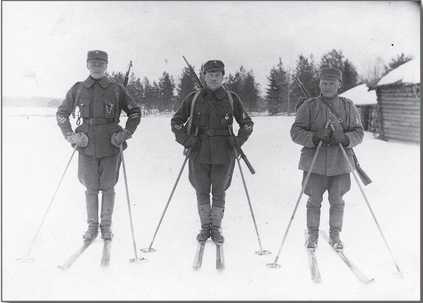
Hiihto oli suojeluskuntien lemmikkilaji 1920-luvulta lähtien myös Jurvassa.

nimeämään ehdokkaat, mutta koska laiminlyönnit tästä huolimatta jatkuivat, Laurila määräsi paikallis- tai aluepäälliköitä itse ottamaan urheiluneuvojan tehtävät. Tämä ei ollut mitenkään tavatonta, sillä sinänsä tehokas ja kaikkialle ulottuva urheiluorganisaatio kohtasi etenkin alkuvaiheessa ongelmia sitä enemmän mitä alemmas hierarkiassa edettiin. 209