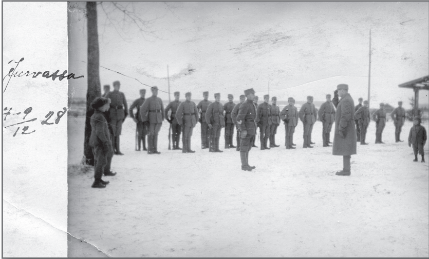
Sotilaallinen koulutus oli merkittävä osa suojeluskunnan toimintaa myös Jurvassa. Syysharjoituspäivät pidettiin Järvenpäässä 7.–9.12.1928.

Jurvan suojeluskunnalla tuntui alussa olevan puutetta lähes kaikesta: jäsenistä, varoista, puvuista, aseista, patruunoista, saniteettitarpeista. Sillä ei ollut myöskään kouluttajia. 172 Vuoden 1920 vuosikertomuksessa valitellaan varsin suorasanaisesti toiminnan lamaantunutta tilannetta: ”Jos teemme lyhyen yleiskatsauksen sk:n kehitykseen viime vuodelta, niin täytyy surulla sanoa, että innostus on suojeluskuntalaisilta melkein kaikki. Harjoituksista ei viime vuonna loppupuolella ole tullut juuri mitään. Innokkain kylä Sk:ssamme on Närvijoki, josta on jotain toivoa. Suurimpana innostuksen laimeuttajana on ehkä se, että ei ole voitu jakaa varustuksia ilmaisek-