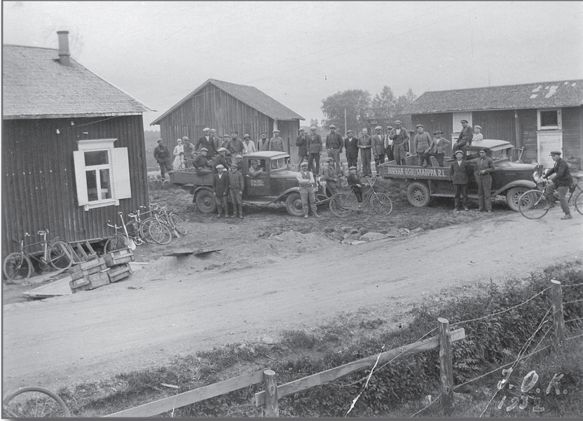
Jurvan kirkonkylän uusi osuuskaupparakennus valmistui ”kökällä” 1930-luvun alussa.

kylässä, Sarvijoella ja Närvijoella. Pioneeriosuuskauppa, jonka toiminta oli ehtinyt jo hiipua, perustettiin uudelleen vuonna 1904 nimellä Osuuskauppa Alku. Tässä vaiheessa sen toimikuntaan kuului jo kirkonkylän vauraampaa talollisväestöä. 69 Jurvan Osuuskauppa koki vaikeita aikoja etenkin 1930-luvun taitteen pulavuosina, mutta uusi nousu alkoi pian niiden päätyttyä, ja vuosikymmenen lopulla osuuskauppa oli kunnan ”mahtijärjestöjä”, sillä jäseniä oli lähes 800. Lotta Svärdin paikallisosasto liittyi osuuskaupan jäseneksi vuonna 1935. Muutoinkin suhteet vaikuttavat olleen hyvät, sillä sota-aikana osuuskauppa tuki taloudellisesti paikkakunnan lottia ja suojeluskuntia. 70