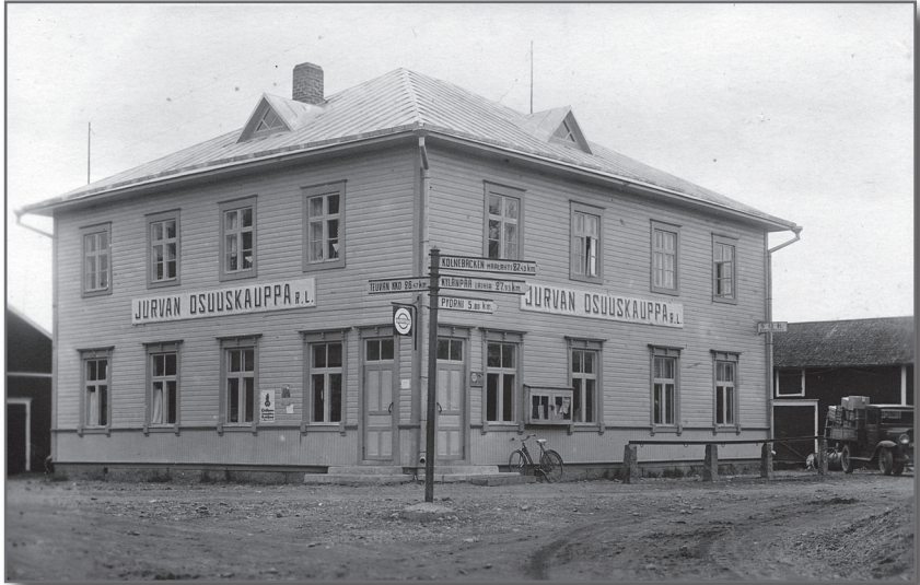
Uusi osuuskauppa oli keskellä kirkonkylää.