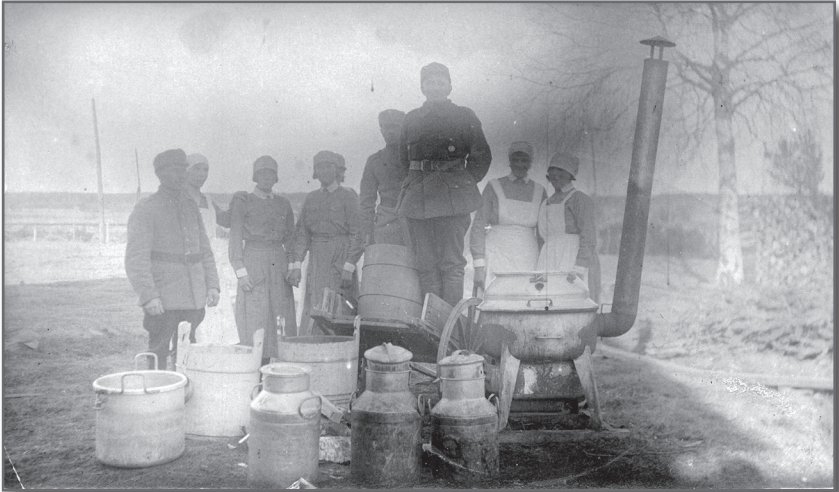
Lottien paikallisosaston ensimmäisiä ja tavanomaisimpia tehtäviä 1920-luvulla oli suojeluskunnan harjoitusten muonittaminen.