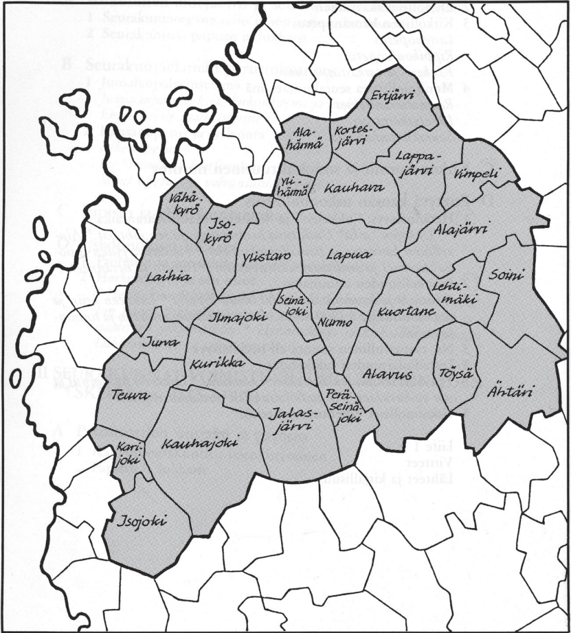
Kartta 1. Etelä-Pohjanmaa.

Lähde: Etelä-Pohjanmaan historia VI, 10.