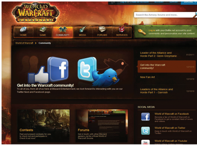
Kuva 2. Nuoret keskustelevat anonyymisti usein pelillisissä ympäristöissä. World of Warcraft -pelaaja voi linkittyä peliyhteisön sivuilta muihinkin verkko-yhteisöihin. ( http://eu.battle.net/wow/en/community/ )

nessa keskustelun tilat ovat tavallisesti selvästi jakautuneita sukupuolen mukaan: tytöt saattavat luoda hahmon goSupermodel-sivustolle 8 ja keskustella nukkemaisten hahmojen välityksellä esimerkiksi muodista toistensa kanssa. Pojat taas hakeutuvat usein taistelupeliympäristöihin. Näiden lisäksi verkossa on myös yleisiä keskustelufoorumeita (esim. Suomi24.fi), mutta niitä tutkimuksemme haastatellut nuoret eivät juuri käyttäneet.