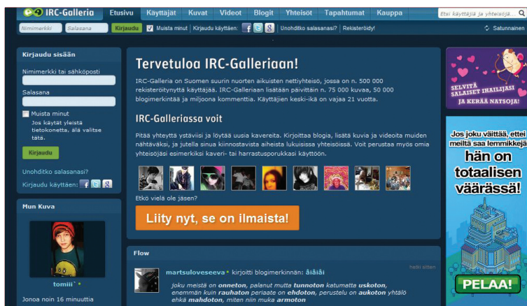
Kuva 1. IRC-gallerian kaltaisissa kuvapalveluissa nuoret näyttäytyvät kaiveripiirilleen. ( http://irc-galleria.net/ )

simmäistä nuorten toiminnan sfääriä ovat perinteisesti perhe, koulu ja vapaa-aika (Salasuo 2006, 40). Vaikka mediatilatkin ovat usein vapaa-ajanvieton paikkoja, niille on leimallista neljänsille tiloille tyypillinen kontrolloimattomuus: ne ovat toimintaympäristöjä, joihin aikuisilla tai vanhemmilla ei ole vapaata pääsyä. Koti on usein vanhempien tarkasti säätelämä alue ja monilla nuorilla on myös kotiintuloajat. Verkko mahdollistaa yhteyden kodin ulkopuoliseen maailmaan omasta huoneesta käsin kotiintuloaikojen jälkeenkin. Internetin yhteisöpalvelut tarjoavatkin areenan nuoren tärkeisiin kehitystehtäviin: identiteetin etsimiseen ja testaamiseen, seurusteluun vastakkaisen sukupuolen kanssa ja irtiottoon vanhemmista (Salokoski & Mustonen 2007, 23).