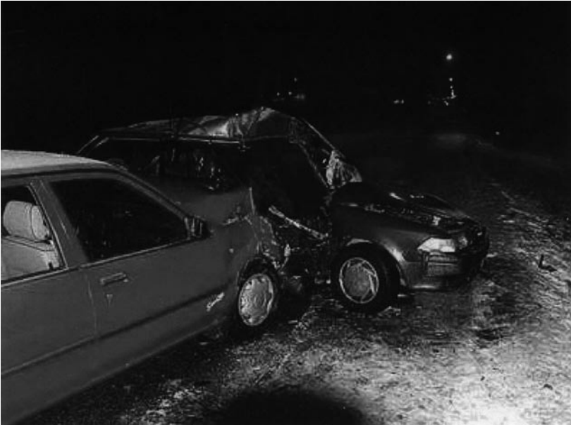
KUVA 1. ”Raahelaismies kuoli kolmen auton kolarissa.”