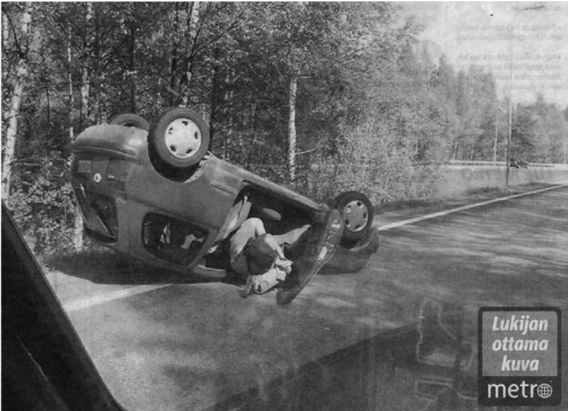
KUVA 2. ”Raju kolari Kehä I:llä. Auto lensi peräänajossa katolleen.” Lukijan ottama kuva, Metro, 27.5.2009.