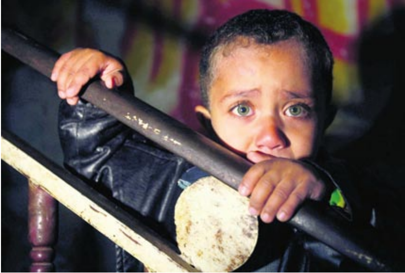
KUVA 3. ”Gazan pommitus uhkaa sytyttää myös länsirannan”. Helsingin Sanomat 30.12.2008.

pommitus uhkaa sytyttää myös Länsirannan”. Kuvan surusilmäisestä pikkupojasta on ottanut Reutersin valokuvaaja Ibraheem Abu Mustafa, ja sen yhteyteen on liitetty kaksi erilaista kuvaa: alempana on karttakuva Palestiinan ja Israelin alueesta sekä sen vieressä pieni kuva panssari-vaunuista. Artikkelin kontekstin yhteydessä esitettiin uudelleen samat kysymykset kuten edellä pelkästä kuvasta.