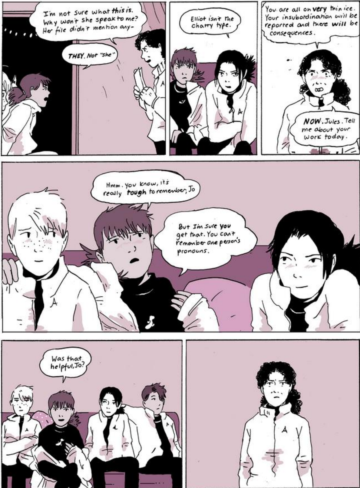
Kuva 3. OAS, 164 (kaappaus verkkosarjakuvasta).