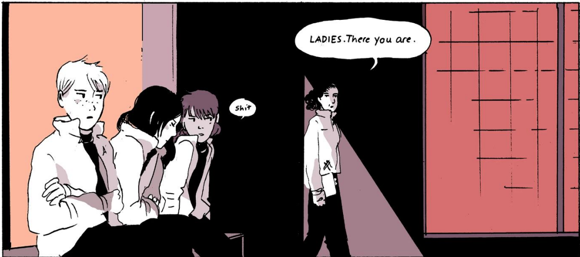
Kuva 6. OAS , 158 (yhden ruudun rajaus, kaappaus verkkosarjakuvasta).

Teoksen lajityyppi vaikuttaa olennaisesti siihen, kuinka sukupuolta tuodaan teoksessa esille. Teos hyödyntää tieteiskirjallisuuden mahdollisuuksia poiketa perinteisistä sukupuolikategorioista, ja nuorten aikuisten queer-kirjallisuuden edustajana se toistaa lajityypin emansipatorisia konventioita. Naisten välisten suhteiden kuvaus ilmenee utopistisena ja normatiivisena, mutta teoksessa otetaan kantaa queer-ihmisten kokemuksiin hankaluuksiin. Näistä vaikeuksista huolimatta teos on optimistinen kuvaus queer-kokemuksesta, ja korostaa yhteisöllisyyden merkitystä.