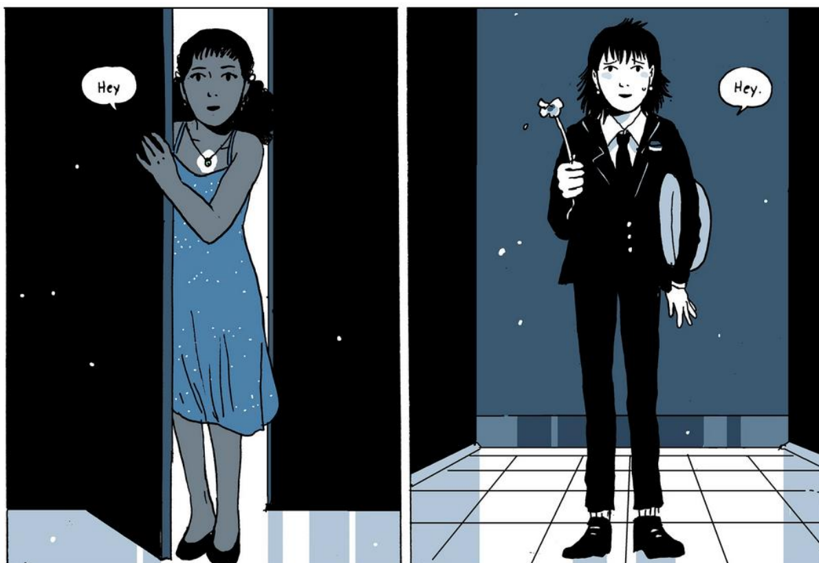
Kuva 1. OAS , 146 (kahden ruudun katkelma, kaappaus verkkosarjakuvasta).

As the couple float to the dance on the hoverboard, Mia stands up straight on the board's forward edge, and Grace embraces Mia from behind, visually lining up the couple's posture and stance with traditional gender definitions as well. As they 'float' loosely within these visually coded roles, they are choosing to experiment with gender roles rather than being dictated by them (mt, 122).