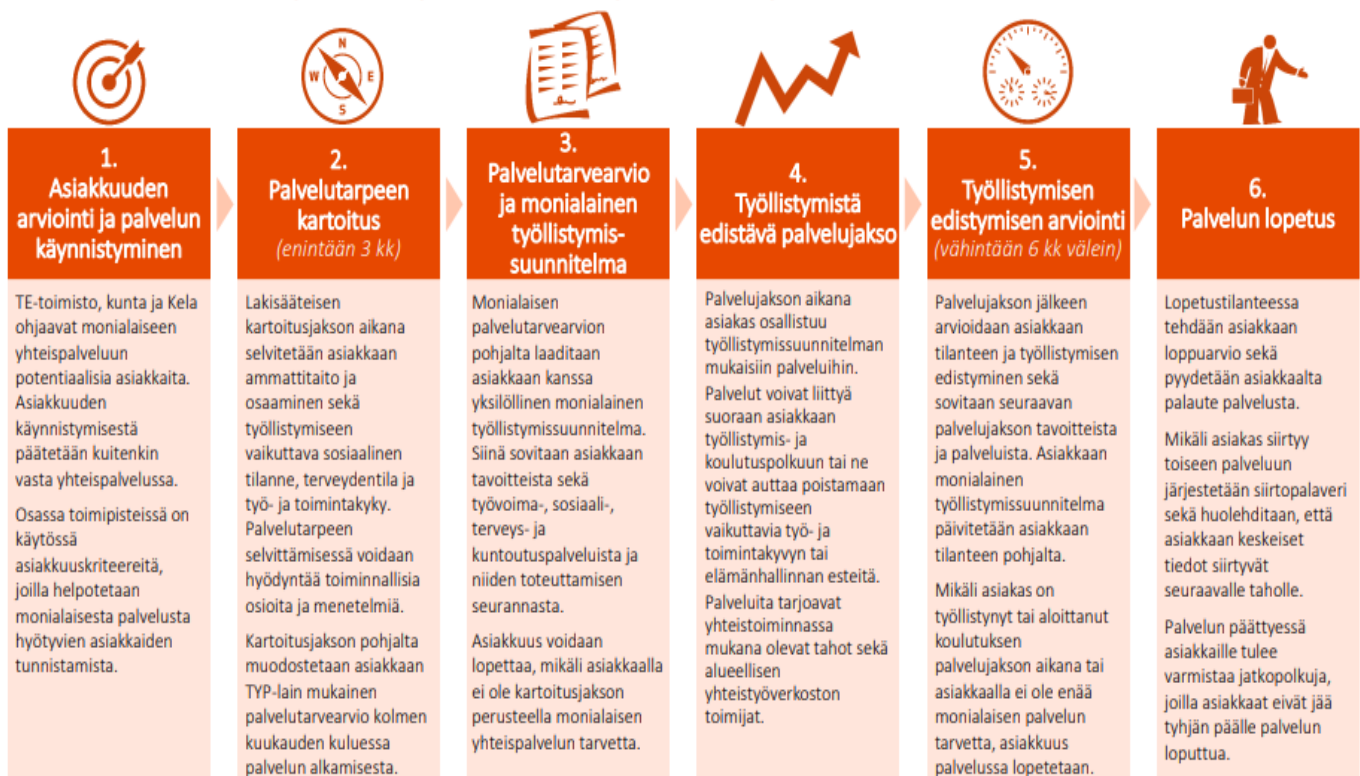
KUVIO 1. Monialaisen yhteispalvelun prosessi (Kuntaliitto 2019)