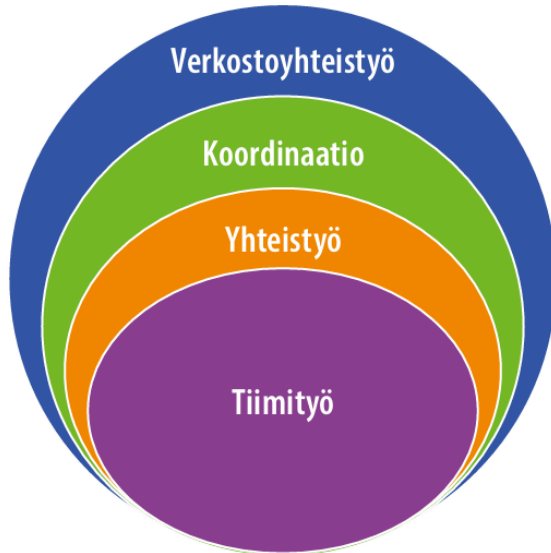
KUVIO 3. Monialaiset yhteistyömuodot (Reeves 2010, Reeves ym. 2018)

Reevesin mallin Monialaisuuden yhteistyömuodoista Kuviossa 3., josta voi hyvin havaita miten monitasoista yhteistyö voi olla.