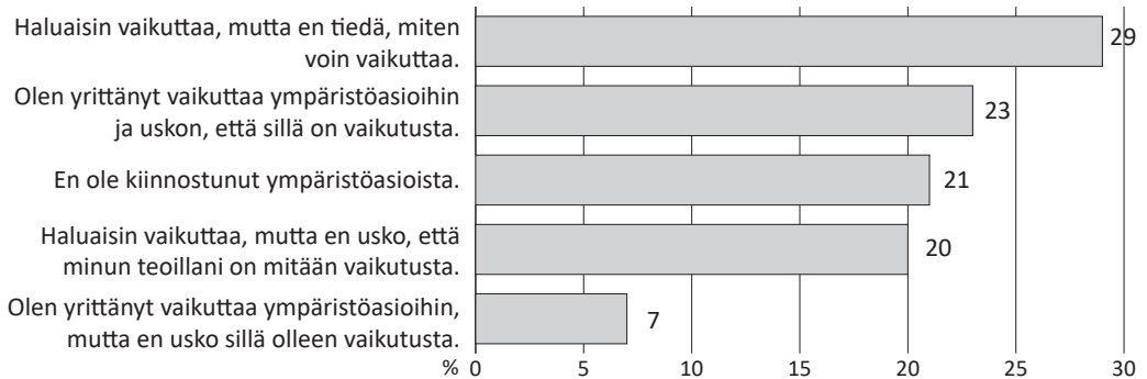
Kuvio 3. Vaikuta!-päivään osallistuneiden 9.-luokkalaisten ajatuksia vaikuttamisesta toisiin ihmisiin ympäristöongelmien ehkäisemiseksi tai poistamiseksi (% vastanneista, N=160).

noin kymmenesosa vastaajista, joille oli jäänyt mieleen jokin luontokokemus, ei ollut kiinnostanut ympäristöasioista. Lisäksi tutkimme kielteisten vastausvaihtoehtojen yhteyttä luonnossa viihtymättömyyteen. Niistä yhdeksästä nuoresta, jotka eivät viihdy lainkaan luontoympäristössä (tai heidän vastauksensa luonnossa