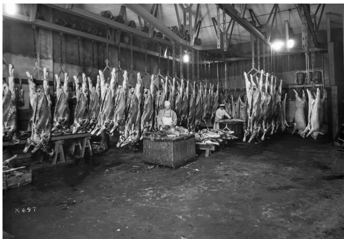
Kuva 7. Osuusteurastamo Karja-Pohjolan jäädyttämöosasto lokakuussa 1936.

Hän ei koskaan hätyytellyt tai lyönyt hoidokkejaan vaan puhuteli näitä nimeltä ja kyhnytteli lempeästi ymmärtäen olevansa tekemisissä elävien olentojen kanssa. Samalla hän ymmärsi, että mustelmat ja muut ruhjeet heikensivät sianlihan laatua ja siitä saatavaa hintaa. Valoisat, puhtaan valkoisiksi kalkitut ja raikkaat mallisikalat puolestaan muistuttivat aikakauden funktionalistisia asumisihanteita. Siat palkitsivat saamansa huolenpidon pysymällä terveinä, tyytyväisinä ja rauhallisina sekä kehittymällä halutun kaltaiseksi lihatavaraksi. Hoitajiinsa kiintyneinä ne kuljivat helposti ”esim. tarhaan, laitumelle ja punnituslaatikkoon, vieläpä lopulta teurastuspaikallekin”. 64 Kyse oli hoito-oppaiden rakentamasta ideaalimaailmasta, mutta isossakaan sikalassa ei vielä yleensä ollut yli kymmentä sikaa, joten eläinten huomioi-