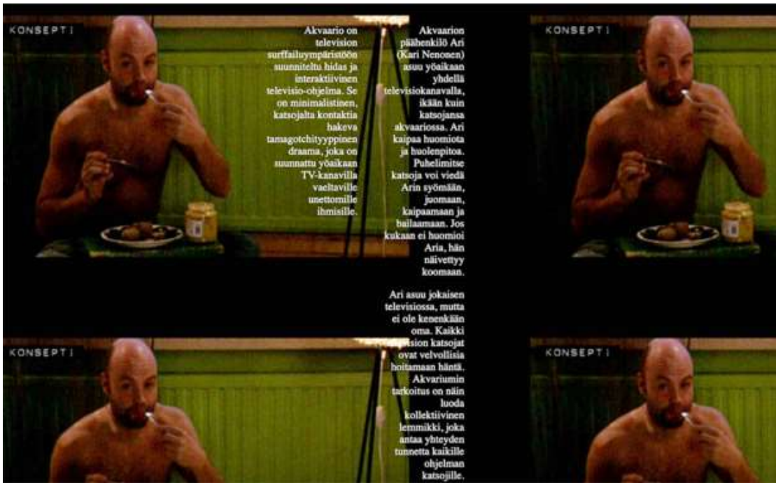
Kuva 3. Akvaario (2000) oli kokeilu, jossa katsojat pääsivät tekstiviestien avulla ohjailemaan ohjelman päähenkilöitä.

tuttu iTV-viihteen puolelta, niin TV-chattien, Tv-mobiilipelien kuin tosi-tv-äänestysten myötä. (Ks. esim. Tuomi 2015) Kahta akvaariossa elänyttä verrattiin Tamagotch-virtuaalilemmikkiin, sillä elleivät henkilöt saaneet mitään käskyjä eli huomiota yleisöltä, menivät ne katatoniseen tilaan ja olivat liikkumatta, tekemättä mitään. Kyseessä oli kuukauden mittainen erikoinen koe, joka yhdisti tosi-tv:n banaaliuden yleisön vuorovaikutteisuuteen osana ohjelmaa.