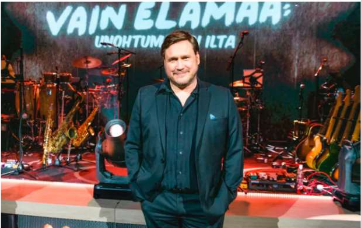
Kuva 19. Samuli Edelmann käsikirjoitettu käytös rikkoi jälkikäteen käsitystä ohjelmasarjan autenttisuudesta. Lähde: IL 21.4.2022 .

Samuli Edelmann muistelee Vain elämää -kokemustaan muiden artistien kanssa erikoisohjelmassa.