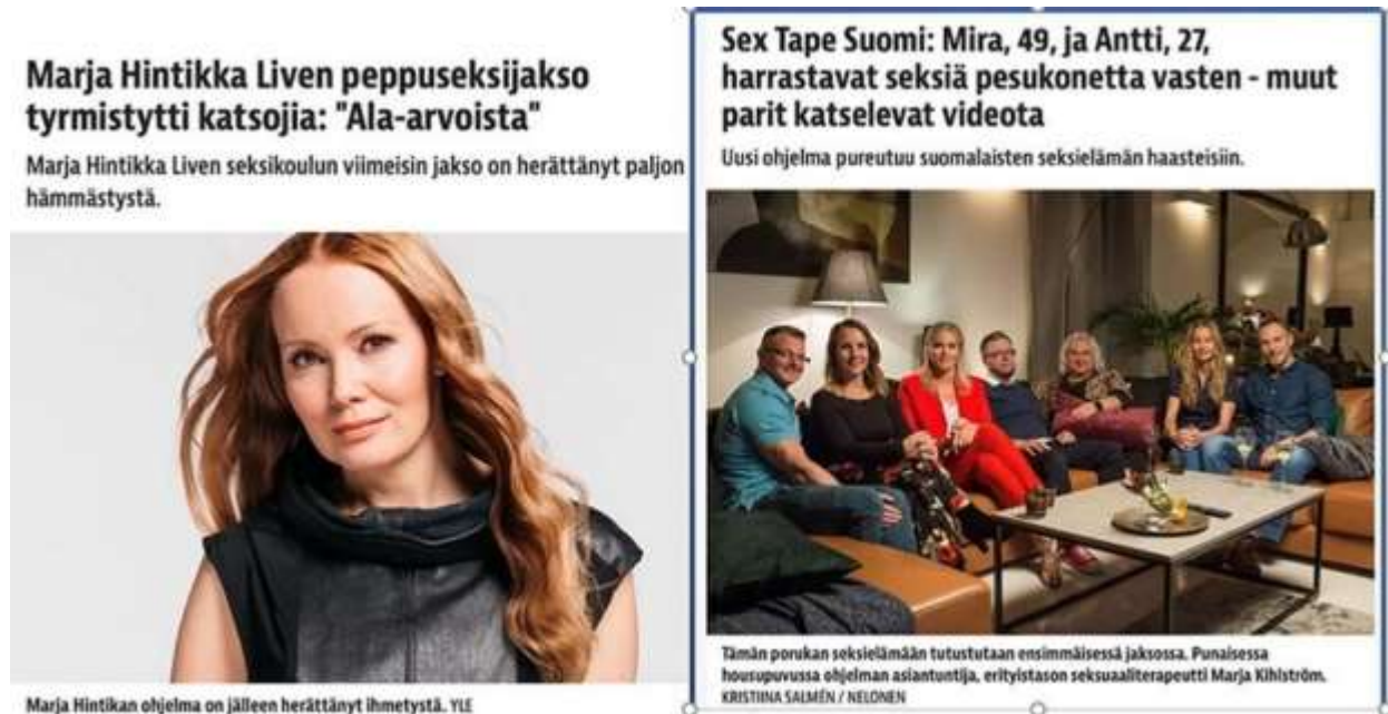
Kuva 10. Lähteet: IL 1.3.2016 & IL 13.3.2020 .