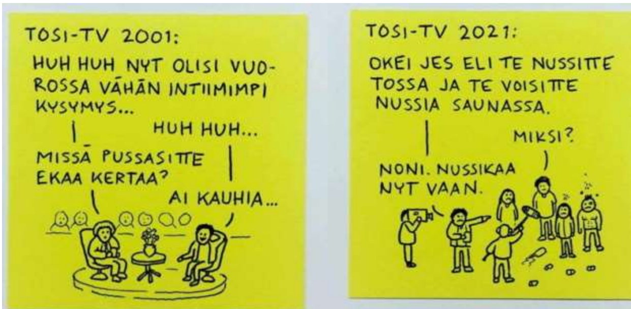
Kuva 40. Anonyymien Porilaisen Pieruperseen meemi kuvaa osuvasti tosi-tv:n kulttuurista muutosta kahdenkymmenen vuoden perspektiivillä. Lähde: Pieruperse 4.5.2021 .

niin sanottuun parhaaseen katseluaikaan. Jotkut teemat siis ovat vain muuttuneet entistä raflaavammiksi ajan saatossa. Sosiaalinen media myös muokkaa jatkuvasti ajatuksia seksuaalisuuden julkisuudesta. Samoin esimerkiksi Alaston Suomi -sivustolla nykyään jo yhä useampi esiintyy tunnistettavasti, ja se muuttaa ajatusta julkisesta seksuaalisuuden kulttuurista. Tällä hetkellä, jos katsotaan Suomen tosi-tv:n tarjontaa ja sen kontroversiaaleja muotoja, voidaan huomata, että kenties tietty rietastelu ja törky ovat paikoin jo turhankin normalisoituneita. Mikä ennen oli täysin häpeällistä, on tällä hetkellä jo osittain ylpeyden aihe. Anonyymi meemitili Pieruperse kuvaa hyvin niin tosi-tv:n kuin asenteidenkin historiallista muutosta (Kuva 40).