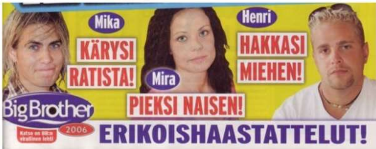
Kuva 21. Seiska revitteli Big Brother -osallistujien rikollistaustoilla jo vuonna 2006.

Tässä on selkeä yhtymäkohta nykypäivän deitti-realityihin, joihin toistuvasti pääsee mukaan henkilöitä, joilla on joko auki olevia rikossyytteitä tai tuoreita tuomioita väkivaltarikoksista raiskauksiin. Näin tapahtuu jatkuvasti, vaikka ohjelmiin ei enää postikorteilla haetakaan. Temptation Island -sarjan juhlakauden (10. kausi) osalta syksyllä 2021 syntyi valtava kohu, kun casting-vaiheen läpi oli päässyt ohjelmaan peräti viisi rikostaustaista osallistujaa. Tämä alleviivaa sitä, että Suomessa osallistujien tausta- ja selvitystyö ei ole kovin systemaattista, koska tuotanto vaikuttaa nyt vetoavan lausuntojen perusteella pitkälti vain osallistujien omaan rehellisyyteen. (Tuomi 2022a, 15) Leväperäinen valintapolitiikka herättää luonnollisesti kritiikkiä ja media ottaa näin syntyneistä kohuotsikoista aina kaiken julkisuusarvon irti. (Kuva 21)