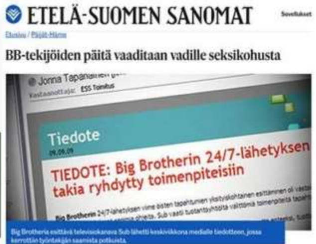
Kuva 5. Big Brother synnytti vuonna 2009 skandaalin "näyttämällä liikaa".

Seksiakteja on sittemmin nähty Big Brotherissa , muun muassa vuonna 2019, jolloin sama "virhe" toistui. Tällä kertaa sitä ei kuitenkaan alleviivattu vahingoksi, vaan myönnettiin, että se oli näytetty tarkoituksella.