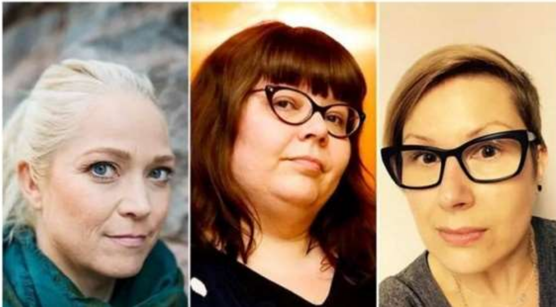
Kuva 13. Asiantuntijoiden kriittistä kärkeä Olet mitä syöt -ohjelmaa vastaan Helsingin Sanomissa.