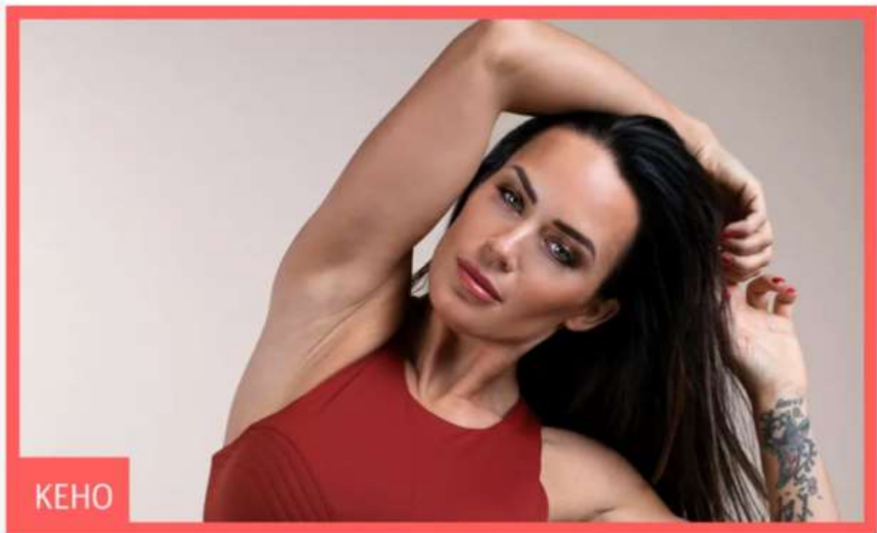
Kuva 14. Aitolehden kehonmuokkaukseen keskittyneen ohjelman koettiin pyörivän itsekeskeisen kehonkuvan ympärillä.

Revenge body with Martina Aitolehti -uutuussarjassa vastataan elämän haasteisiin kehoa muokkaamalla. Miten kosto sopii nykypäivän hyvinvointiajatteluun?