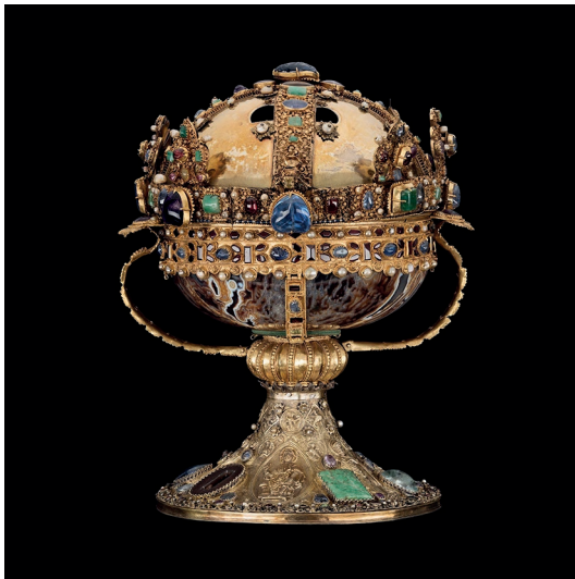
Bild 4. Relikvariet för S:ta Elisabeths huvud.

I Sverige är de relikvarier som ingick i krigsbytet någorlunda systematiskt registrerade. År 1632, ett par decennier innan Vadstenarelikvarierna återkom bland krigsbytet från Polen, kom två andra relikvarier som krigsbyte från Centrala Europa: ett korsrelikvarium från domkyrkan i Halle 67 och ett ciborieliknande relikvarium för huvudskallen av Heli-ga Elisabeth av Thüringen. Den sistnämnda relikvaren hade redan flyttats till klarissaklostret i Wien när relikvariet flyttades från Marburg till Marienbergs fästning i Würzburg inför kriget. Något liknande har knappast existerat i