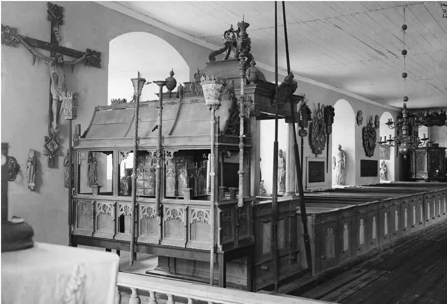
Bild 3. Det s.k. Hemmingskrinet från Åbo Domkyrka och andra kyrkliga föremål tillfälligt utställda i Åbo slotts kyrka.

jade de bortglömda föremålen inventeras utan stor entusiasm: "Några stycken gamla träbilder stå här och där kring kyrkan, som man ej håller mödan värt att upräkna, och annat dylikt" var den första beskrivningen av skulpturerna. På 1800-talet väckte skulpturerna nytt intresse och fick en ny roll som kvarlevor av kyrkans historia. Helgonkulten hade redan blivit så främmande att nya meningar kunde projiceras på bysten: den kallades Jungfrun från Venngarn och associerades till en lokal (tydligt helgonlegendspirerad) tradition om hjältinnan Disa. 60