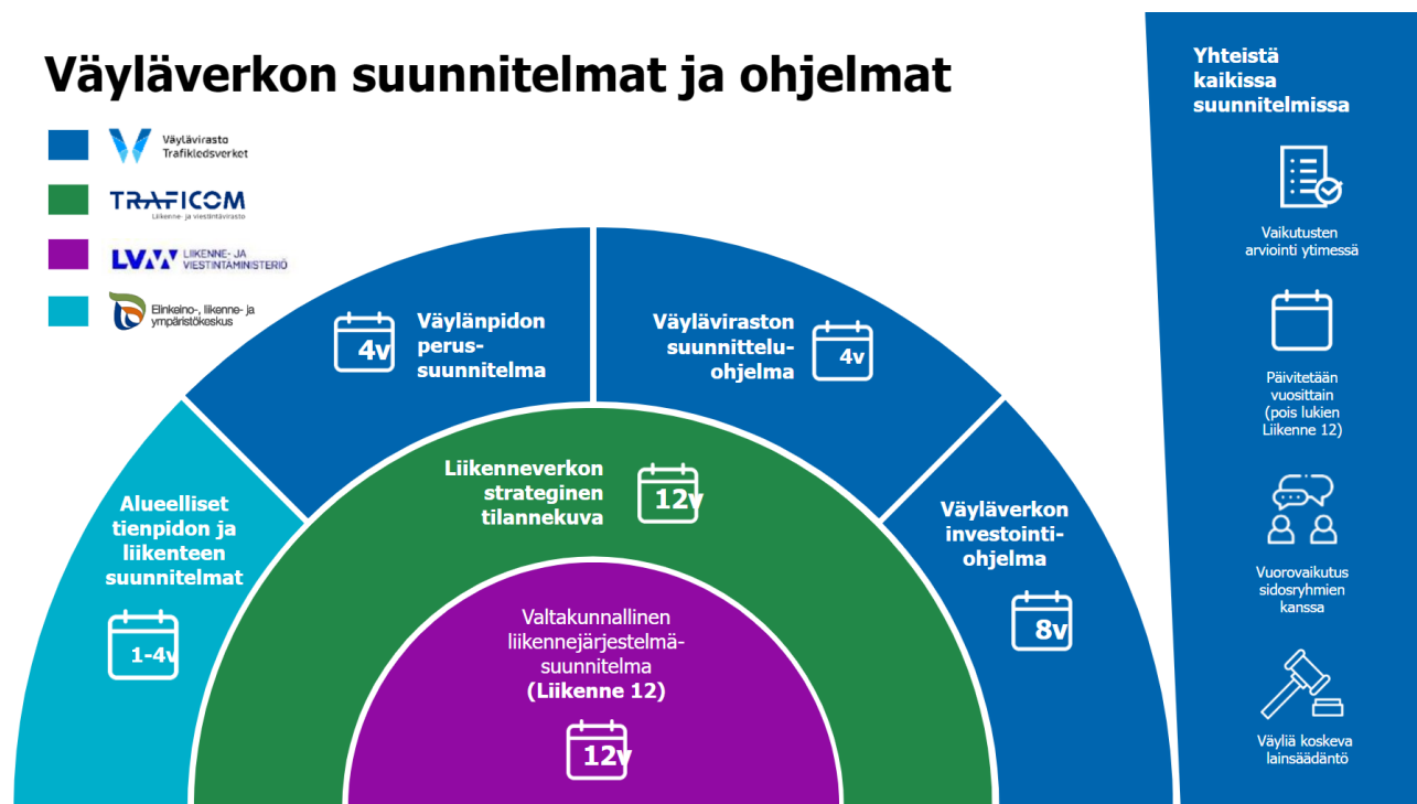
Kuvio 1. Valtakunnallista liikennejärjestelmäsuunnitelmaa toimeenpaneavat väyläverkon ohjelmat ja niiden tavoitteelliset aikajänteet (Väylävirasto 2024b).

Valtion väyläverkon investointiohjelma on Väylävirastossa asiantuntijatyönä tehtävä esitys väyläverkon keskeisimmistä investointitarpeista. Ohjelmassa on hankkeita sekä tie-, rata- että vesiväyläverkolle. Investointiohjelmakokonaisuus sovitetaan poliittisesti määriteltyyn rahoituskehikkoon, eikä se siten välttämättä kata kaikkia Väyläviraston näkökulmasta tarpeellisia investointikohteita. Investointiohjelman hankkeiden varsinaisesta toteuttamisesta päättää eduskunta. Ohjelman tavoitteellinen aikajänne on kahdeksan vuotta, mutta se päivitetään vuosittain. Keväällä 2024 julkaistiin Valtion väyläverkon investointiohjelma 2025–2032 (Väylävirasto 2024b).