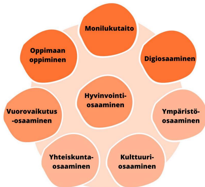
KUVIO 2. TUVA-koulutuksen laaja-alaisen osaamisen osa-alueet (OPH, 2023)

Koulutukselle on asetettu myös laaja-alaista osaamista koskevien perustietojen ja -taitojen osa-alueet, jotka kulkevat läpi opintojen. Osa-alueet on esitelty alla olevassa kuviossa (Kuvio 2).