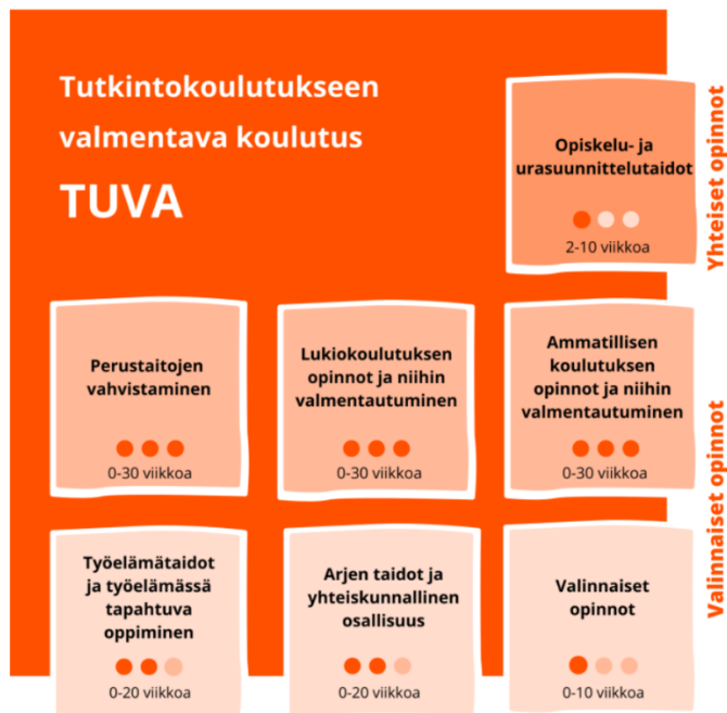
KUVIO 1. TUVA-koulutuksen koulutuksenosat (OPH, 2023)

Koulutukselle on asetettu myös laaja-alaista osaamista koskevien perustietojen ja -taitojen osa-alueet, jotka kulkevat läpi opintojen. Osa-alueet on esitelty alla olevassa kuviossa (Kuvio 2).