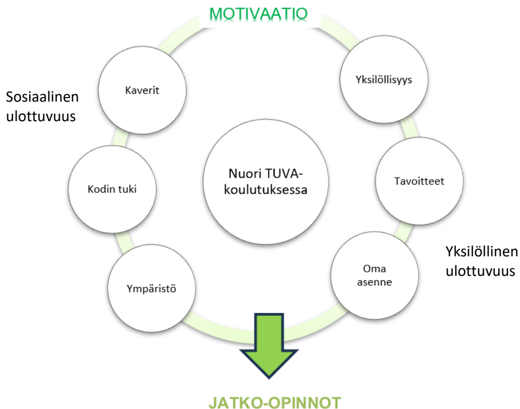
KUVIO 4. Motivaation kehä TUVA-koulutuksessa

Tämän tutkimuksen tavoitteena oli tarkastella nuorten kokemuksia Tutkintokoulutukseen valmentavasta koulutuksesta (TUVA), ja selvittää millaisia merkityksiä he antavat koululle ja koulutukselle. Lisäksi tutkittiin sitä, mitkä tekijät nuorten mielestä vaikuttavat koulumotivaatioon. Tutkimus antaa arvokasta tietoa nuorten näkökulmasta TUVA-koulutukseen, sekä siitä, mitä asioita nuoret pitävät merkityksellisenä motivaation ylläpitämiseksi koulutuksessa. Saatujen tulosten perusteella tehdyt johtopäätökset esitellään alla olevassa kuviossa (Kuvio 4) tiivistetysti.