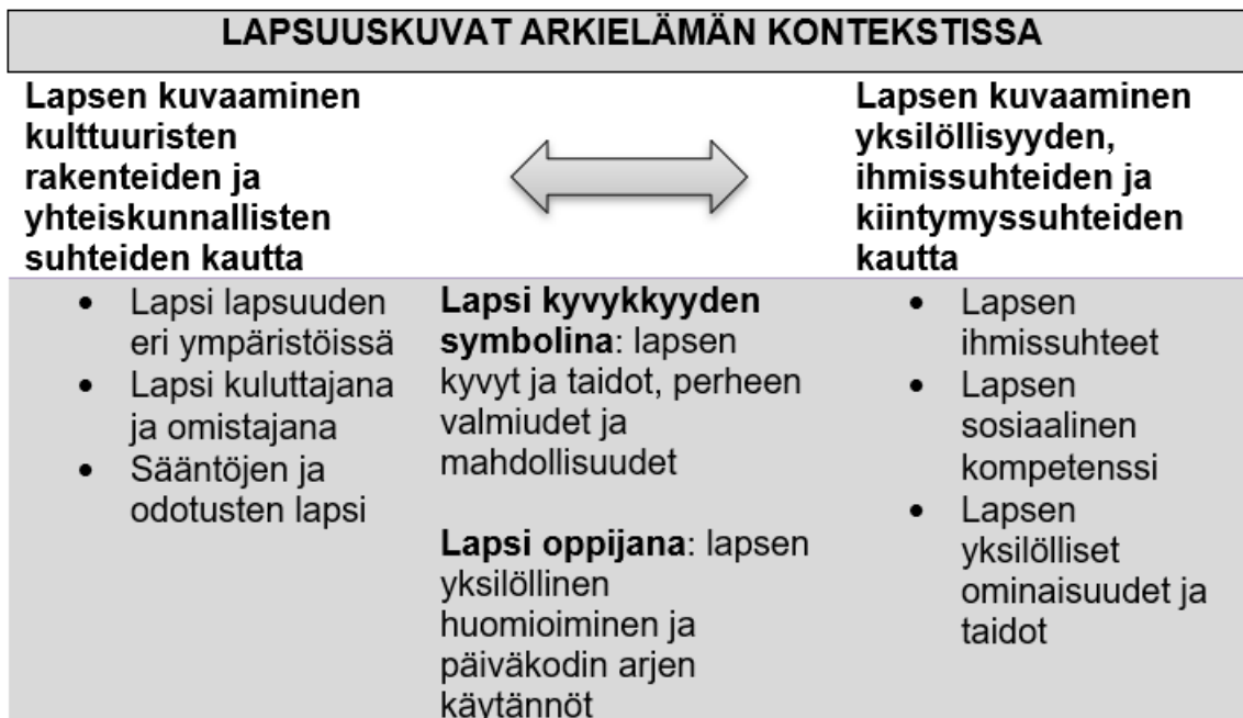
KUVIO 3. Lapsuuskuvat ja niihin liitetyt ominaisuudet (Lämsä ym., 2017)

Tutkimusryhmän mukaan lapsuutta toistetaan globaaleissa diskursseissa, ideologioissa, institutionaalisissa prosesseissa ja niiden tavoitteissa, mutta myös arkipäivän prosesseissa, jotka liittyvät keskusteluihin, käytäntöihin, identiteetteihin ja yksilöiden läheisiin sosiaalisiin suhteisiin. Kuviossa 3 on kuvattuna tarkemmin tutkimuksessa (Lämsä ym., 2017) esiin tulleet lapsuuskuvat ja niihin liitetyt ominaisuudet.