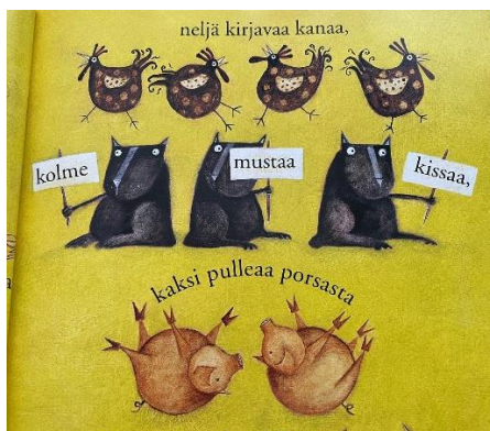
Иллюстрация 2: Толстой, А., Шаркей, Н., AG Design, 1999, с. 4. Jättiläismäinen nauris, Tien Wah Press

Переводчик ввел в перевод аллитерацию. Они создают ритм и мелодию в тексте, что делает чтение более приятным и помогает читателю лучше запомнить текст. Использование аллитерации может создать определенное настроение или стиль в рассказе. Например, мягкие тона могут создать спокойное и нежное настроение, а громкие тона – сильное и напряженное, что подчеркивается в случае с громким смехом. Переводчикам приходится преодолевать значительные языковые различия между русским и другими языками, обеспечивая сохранение волшебных и фантастических элементов сказок (Пропп 2000, 194–238). Когда появляются персонажи, о них рассказывается в забавной иллюстрированной форме: