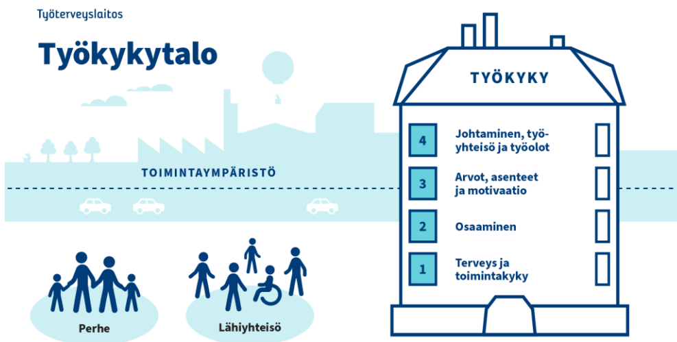
Kuvio 1. Työkykytalo (Työterveyslaitos, materiaalipankki, ei pvm.)