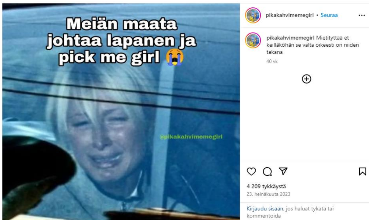
Kuva 4 Lapanen & Pick me girl

Pikakahvimegirlin meemi (23.2.2023, tästä eteenpäin kuva 4) esittää Suomen pääministerin ja valtiovarainministerin halventavina karikatyyreina. Kuva 4 toimii esimerkkinä siitä, miten lukijan tulee olla tietoinen sekä politiikan että meemien maailmasta. Lukijan tulee tunnistaa, että termi "lapanen" viittaa pääministeri Petteri Orpoon ja termi "pick me girl" Riikka Purraan. Suomen poliittisen tilanteen ja gen z -kielen tuntijalle meemi ei ole kovin monimutkainen, mutta ulkopuolinen tarvitsee valtavasti kontekstia meemin ympärille tajutakseen meemin ja sen satiirin.