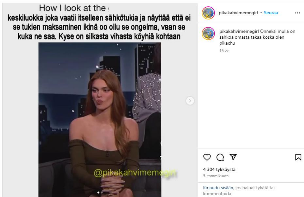
Kuva 3 Keskiluokka

Pikakahvimegirlin Instagram-julkaisussa (5.1.2024. tästä eteenpäin kuva 3) kritiikin kohteeksi joutuu keskiluokka. Tässäkin kuvassa meemin alkuperä on englanninkielisestä ympäristöstä ja käyttää vuoden 2020 puolivälissä alkanutta "how I look at"-formaattia, jossa lauseen jatkoa ja sen alla olevaa kuvaa muokataan uusiksi johdannaisiksi. "How I Be Looking At" -lausemallia käytetään meemeissä, jotka kuvaavat reaktiota, usein ärtymystä tai levottomuutta. (knowyourmeme.fi 2021.) Pikakahvimegirlin tyyliin kieli on hyvin suoraa. Meemin huumori syntyy meemin kuvan henkilön ilmeen yhdistämisestä vakavaan tekstiin sen yläpuolella.