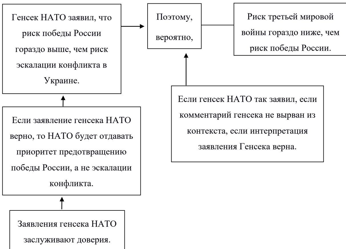
Рис. 3. Анализ сообщения на канале Медведева с помощью модели аргументации Тулмина.

Нам нужно сначала определить утверждение. В данном случае это тяжелая задача, поскольку надо одновременно учитывать несколько разных нюансов. В целом определение утверждения очень важно, потому что все остальные элементы модели Тулмина построены вокруг него. Таким образом, в первую очередь мы интерпретируем утверждение, содержащееся в сообщении, а во вторую – утверждение, якобы сказанное генеральным секретарем НАТО. Утверждение, выделенное в сообщении следующее: риск третьей мировой войны гораздо ниже, чем риск победы России. В этом анализе мы сосредоточимся на утверждении сообщения, но считаем важным представить и второе утверждение, которое гласит: НАТО в лице Столтенберга считает возможность победы России худшим вариантом, по сравнению с эскалацией конфликта в Украине. Сейчас мы рассмотрим утверждение с помощью рисунка: