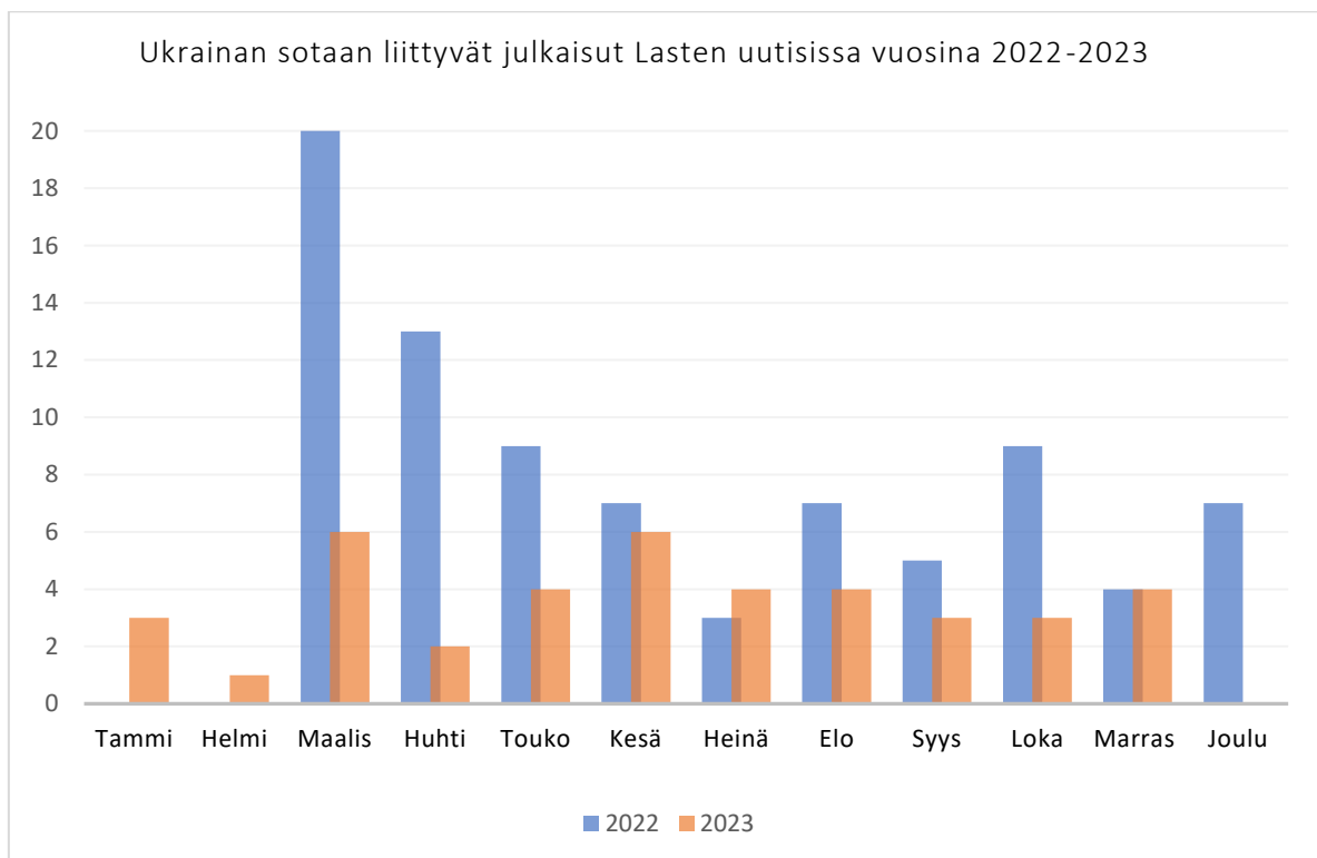
Kuvio 1: Sotauutisten jakauma kuukausittain.

Ukrainan sotaan liittyvien juttujen määrä oli korkeimmillaan aivan sodan alussa, maaliskuussa 2022. Tällöin juttuja julkaistiin neljä kertaa kuukaudessa ilmestyvän lehden sivuilla yhteensä lähes 20 kertaa. Tämän jälkeen julkaisu väheni ja kävi hyvin alhaalla heinäkuussa, jolloin juttuja ilmestyi vain alle viisi kuukauden aikana. Julkaisutahti nousi hieman syksyä kohti, mutta julkaisujen määrä tavoitti enää vain kaksi kertaa vuoden 2023 aikana yli viiden kuukausijulkaisun rajan. Kokonaisuudessaan tutkittavalla ajanjaksolla julkaistiin yhteensä 131 Ukrainan sotaa käsittelevää juttua. Yhdessä sanomalehdessä oli keskimäärin 1–3 aineistoon mukaan sisällytettyä julkaisua. Tutkimusajankohdalle osui myös useampi julkaisukerta, jolloin kaikki printtilehden aiheet käsittelivät jotain muuta kuin Ukrainan sotaa. Alla jako kuvaajalla: