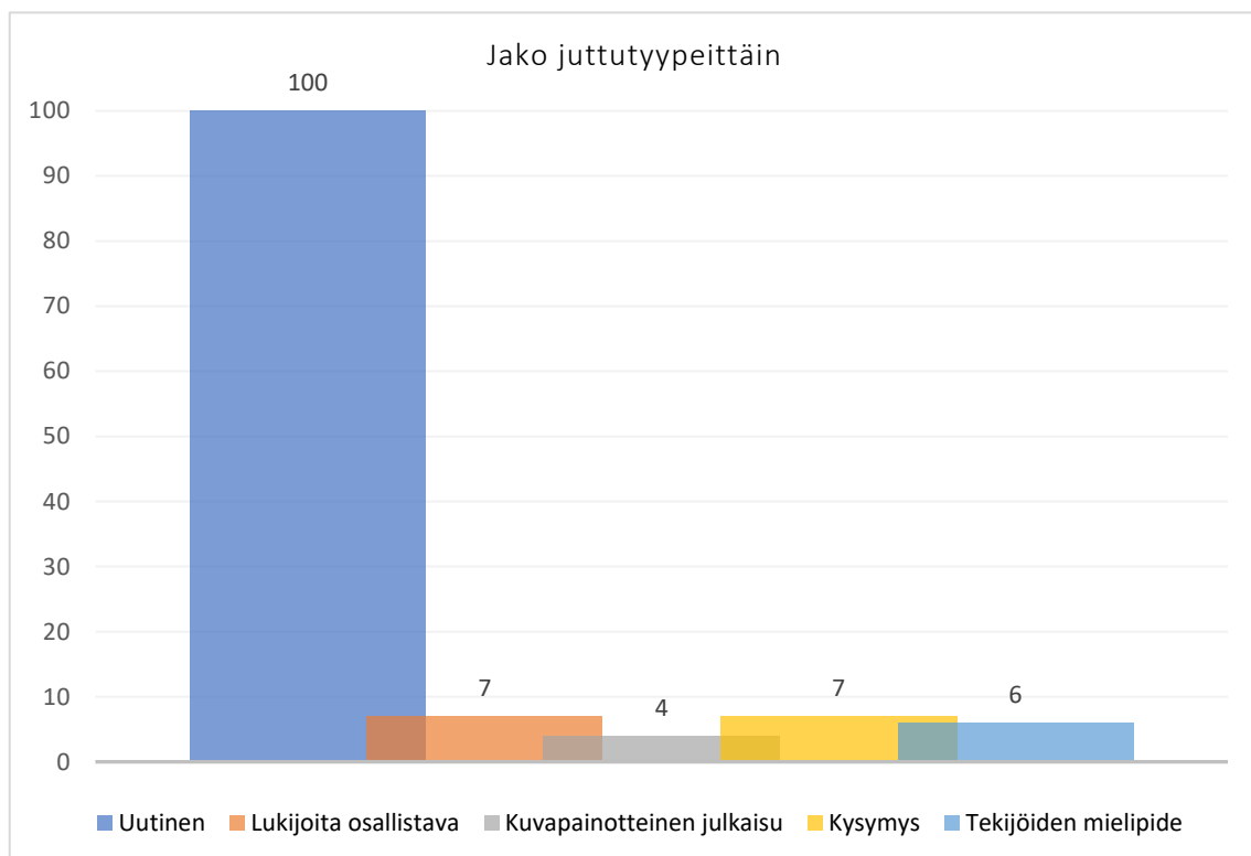
Kuvio 2: Ukrainan sotaa käsittelevien julkaisujen jakautuminen juttutyypeittäin

Aineiston pohjalta näyttää siltä, että Lasten uutiset käyttää aikuisille suunnattua lehteä enemmän kuvia ja esimerkiksi uutiskoosteessa tekstiä on hyvin vähän ison kuvan rinnalla, lähes kuvatekstimäisesti. Pyrin kuitenkin erottelemaan nämä niin, että informatiiviset kuvapainotteiset jutut, jotka ilmestyivät osiossa Kuusi tärkeää uutista , lukeutuivat uutisten kategoriaan. Tämän lisäksi lehdissä julkaistiin ajanjaksolla yksi Ukrainan sotaa käsittävä kuvakooste ja kaksi selkeästi kuvavoittoista julkaisua, jossa sota mainittiin kuvatekstissä.