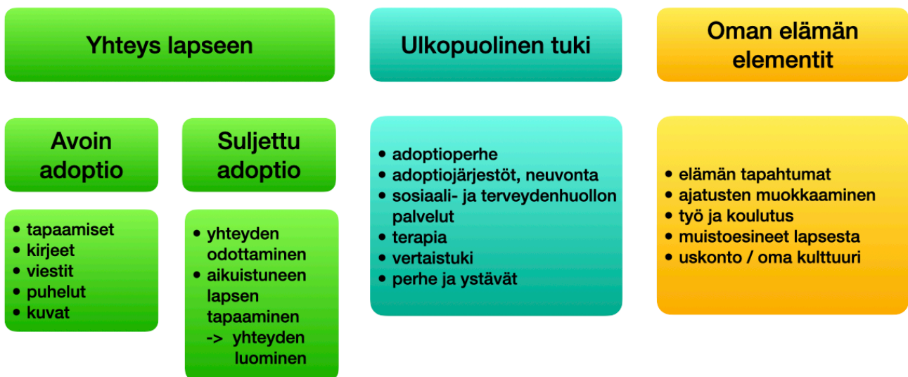
Kuvio 2. Biologisten äitien saama tuki.

Biologiset äidit saavat tukea tunteidensa käsittelyyn ja elämässä selviytymiseen eri tahoilta. Aineiston perusteella biologisia äitejä tukee yhteys lapseen, ulkopuolelta tuleva tuki sekä oman elämän elementit. Alla oleva kuvio (Kuvio 2.) kuvaa tiivistetysti biologisten äitien saamaa tukea.