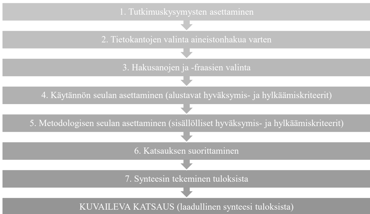
Kuvio 1. Kirjallisuuskatsauksen vaiheet Finkin (2020, 3–7) mallia soveltaen

systemaattiselle kirjallisuuskatsaukselle ominaista vaiheistusta (Fink 2020, 3–7), jonka havainnollistan kuviossa (Kuvio 1.).