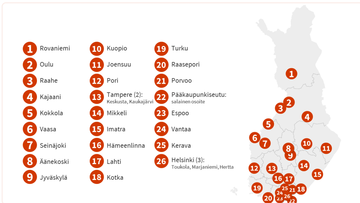
Kuvio 1. Turvakotipaikkakunnat vuoden 2022 lopussa (THL 2023)

Turvakotipalvelut on suunniteltu perhe- ja lähisuhteissa väkivaltaa tai sen uhkaa kokevalle väestölle, ja jotka kokevat tarvitsevansa elämässään tukea väkivallasta selviämiseen sekä osa-aikaisen asuinpaikkaa tilanteessaan. Turvakotipalvelussa tarjotaan välitöntä kriisiapua, turvattua asumista vuorokauden ympäri sekä ihmisen akuuttiin kriisitilanteeseen liittyvää psykososiaalista tukea, neuvontaa ja ohjausta. Turvakotipalvelut ovat asiakkaille maksuttomia ja niissä voi tarvittaessa asioida nimettömänä. Turvakodit toimivat valtionrahoituksella. Suomessa turvakotipalveluiden järjestämisestä, palveluverkoston koordinoinnista ja kehittämisestä vastaa Terveyden- ja hyvinvoinnin laitos (THL 2023). Sosiaali- ja terveystieteiden lupa- ja valvontavirasto (Valvira) sekä aluehallintovirasto (Avi) valvovat turvakotitoimintaa toimialueellaan. Suomen suurin turvakotipalveluiden tuottaja on Ensi- ja turvakotien liitto. (Piispa 2001, 27). Suomessa oli vuoden 2023 alussa yhteensä 29 turvakotia ja niissä on yhteensä 230 perhepaikkaa (Kuvio 1). Jokaisessa maakunnassa on ainakin yksi turvakoti. (Terveyden ja hyvinvoinnin laitos 2023.)