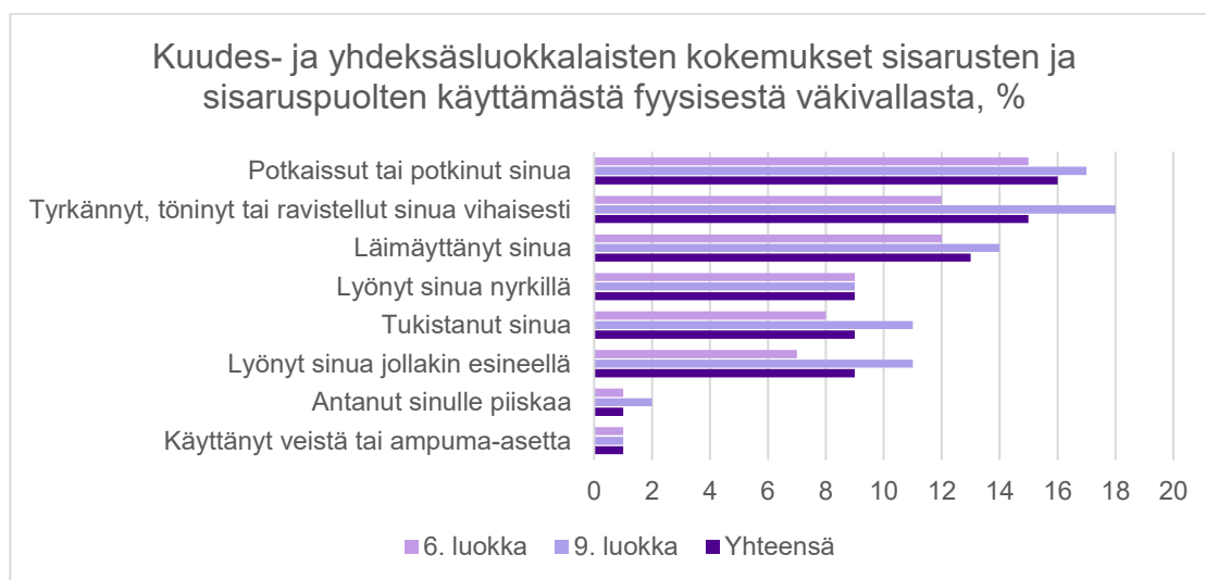
Kuvio 2: 6.- ja 9.-luokkalaisten fyysisen sisarusväkivallan kokemukset %-osuuksina vuonna 2022 toteutetun lapsiuhritutkimuksen mukaan, N =6 825 (Mielityinen ym. 2023).

yhteensä 16 prosenttia vastaajista. (Mielityinen ym. 2023.) Olen havainnollistanut tätä pylväsdiagrammissa kuviossa 2.